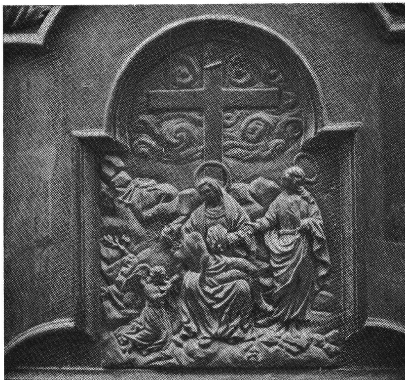
Particolare della porta

e che la giustizia era sacra nei secoli passati, tanto da essere affidata preferibilmente alla chiesa piuttosto che a qualunque istituzione civile.