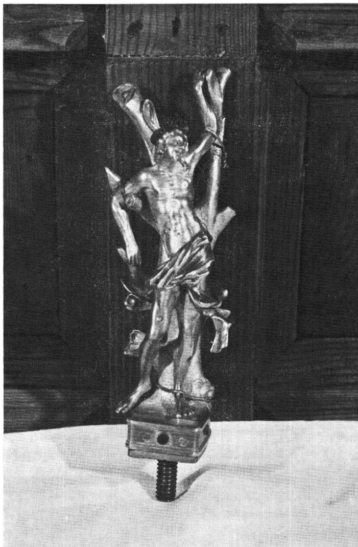
N. 7 — Statuetta da processione di argento, rappresentante San Sebastiano (Vienna 1732)