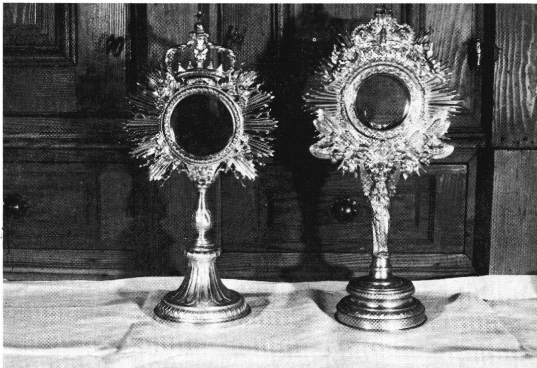
N. 14 e 15 — Ostensori di rame argentato e dorato