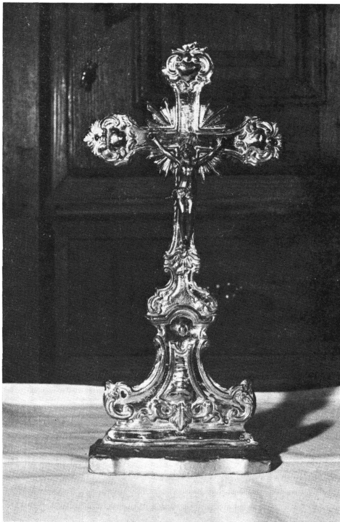
N. 5 — Crocifisso di legno rivestito con lamina di rame dorato e argentato; Cristo di bronzo