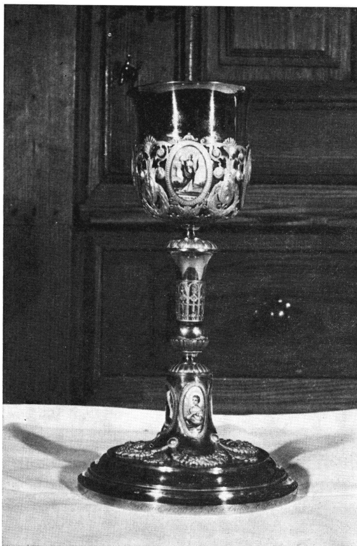
N. 2 — Calice da Messa « a Sonvico » di argento dorato ornato di smalti colorati (Vienna 1820)