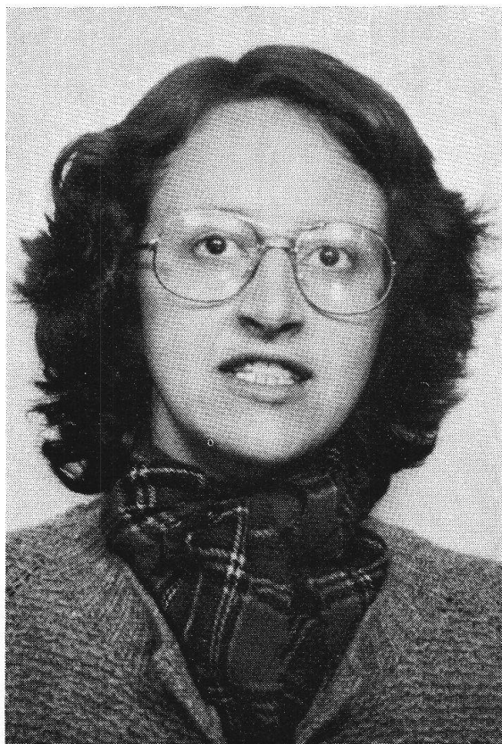
PROFESORESSA POSCHIAVINA A COIRA