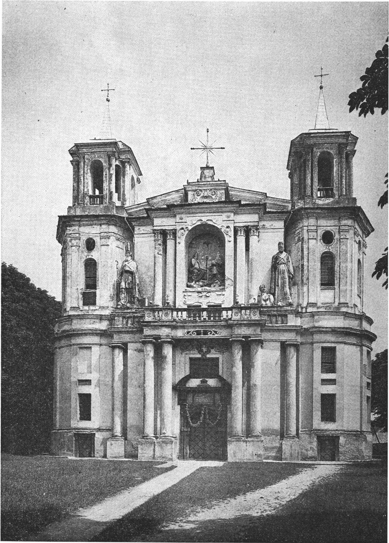
Tarlow, Chiesa parrocchiale, 1647 - 1655, facciata