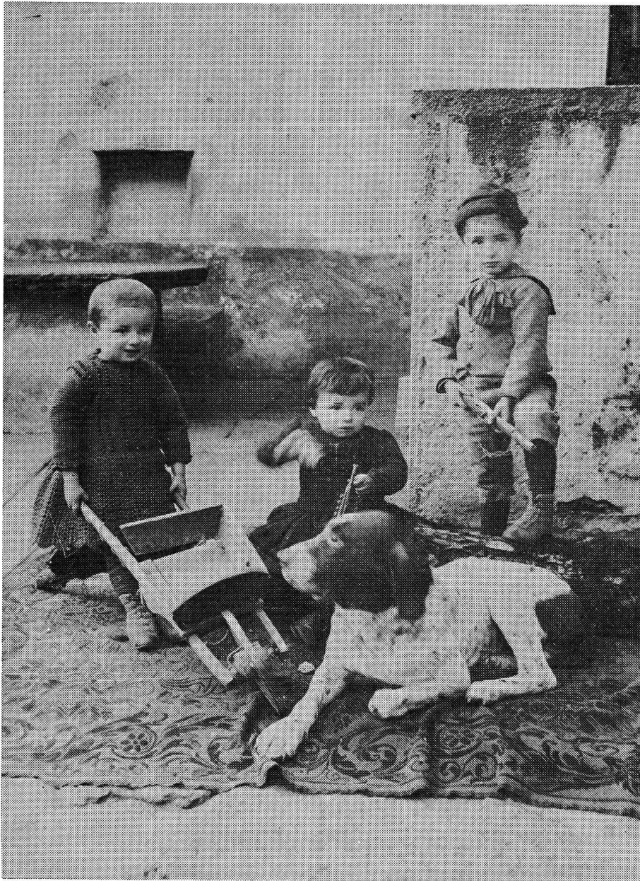
Lostallo 1894 ca.

que importanti per l'educazione dei bambini: questo sul piano della trasmissione dei valori (discorso che verrà toccato più direttamente a proposito dell'educazione religiosa).