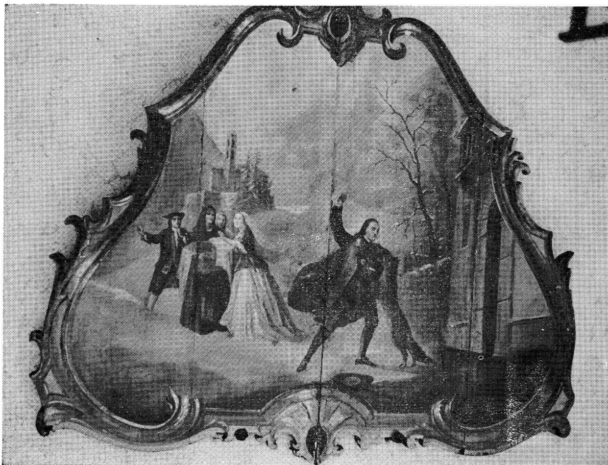
Quadro di autore ignoto (prob. 1700), già di proprietà Famiglia aMarca, Mesocco. Ora proprietà G. P. Rovati, Roveredo.

sè imprescètè la feda, Iddio on la conser- vaga fin a la mort (Buonasera comare, Vi ho portato via un pagano e ho qui un fedele cristiano; ci siamo scambiata la fede; Iddio ce la conservi fino alla mor- te) » 2) .