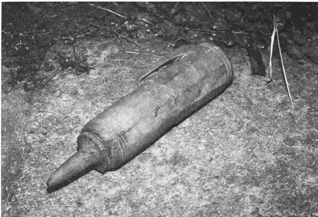
cuzéi di legno