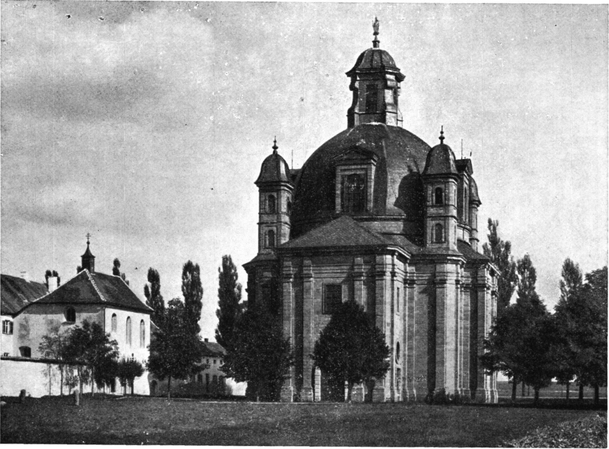
GIOV. ANTONIO VISCARDI: Freystadt, Chiesa votiva, 1700