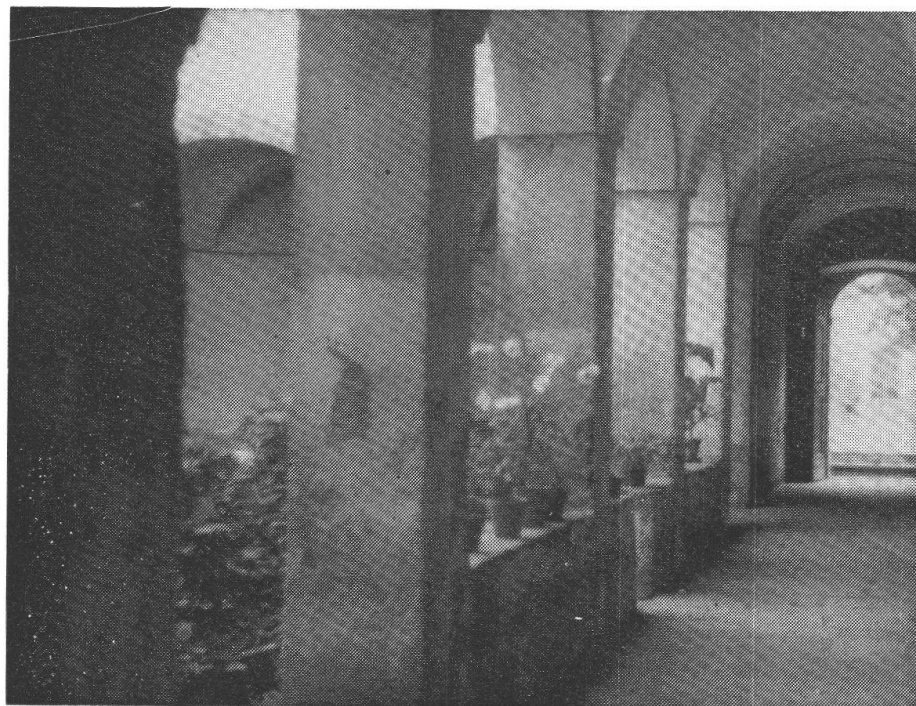
Corridoio del chiostro con porta che dà sul giardino