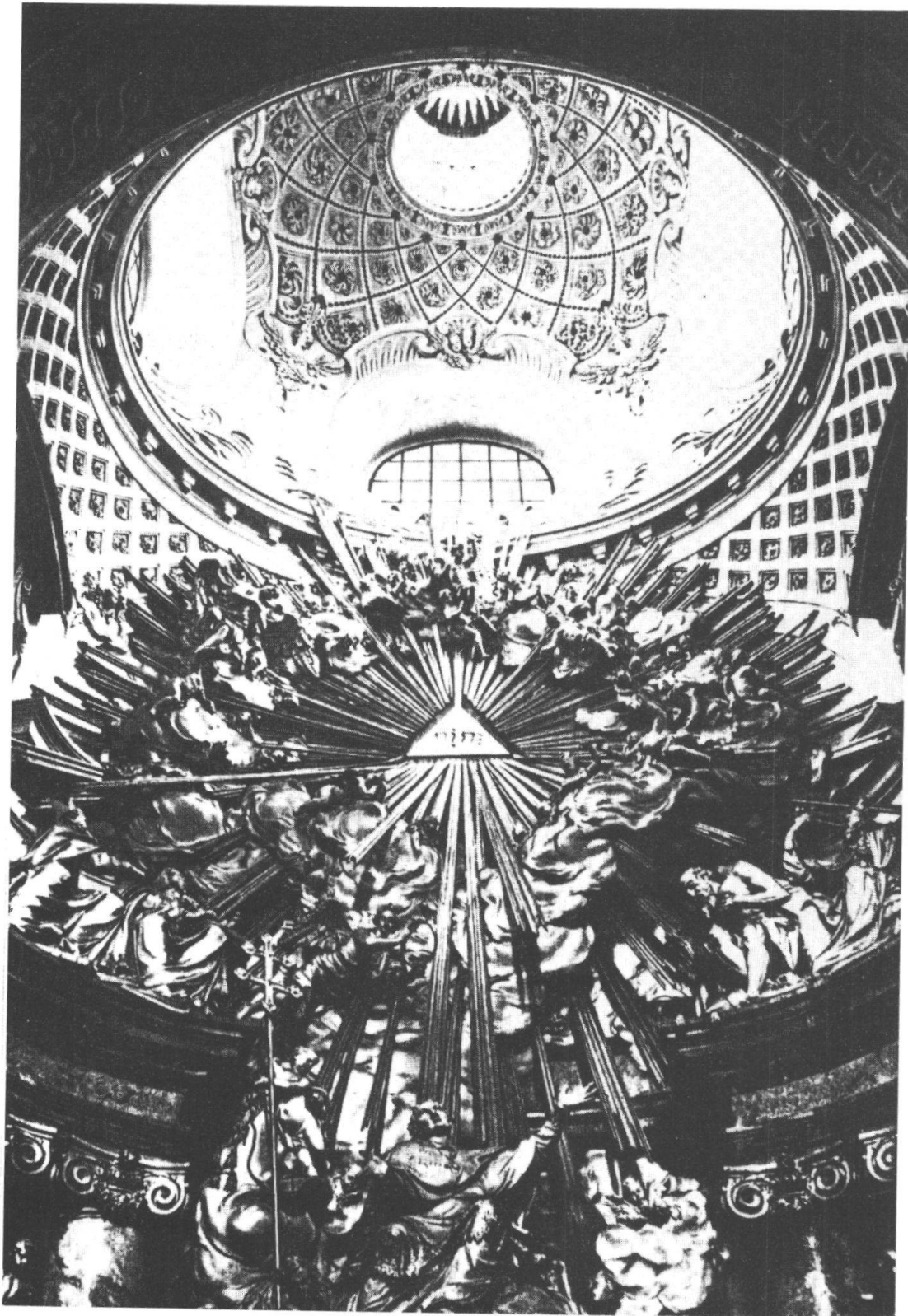
Nella chiesa di San Carlo, l'originale cupola sopra l'altare maggiore con i suoi ornamenti di stucco, opera di Alberto Camessina che si è ispirato a F. Borromini