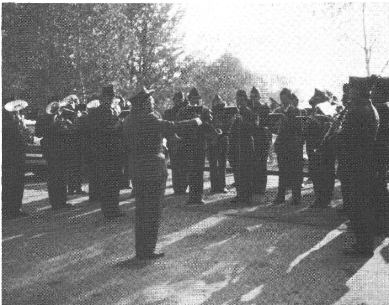
Uno dei segreti per l'equilibrio psicofisico è trasformare lo stress in energia vincente mediante l'alimentazione sana, la ginnastica, il buon umore, la poesia, il canto... e la musica. La fotografia lo illustra: musica e buon umore in una situazione di stress (Monte Ceneri, 12.11.1988)

Come abbiamo già sottolineato, lo stress non è di per sé un male. Essere stressati significa semplicemente essere ben vivi, cioè avere la capacità di reagire agli stimoli. Nel linguaggio comune, invece, chi è «stressato» non sta bene perché subisce o sta subendo un eccesso di stress. Selye ipotizza che ciascuno di noi è dotato di una certa quantità di «energia di stress» non recuperabile con il riposo e quindi da usare con parsimonia nel corso della vita. Chi ne consuma troppa è destinato a morire prima, e la vecchiaia sarebbe appunto l'esaurimento nervoso di questa energia.