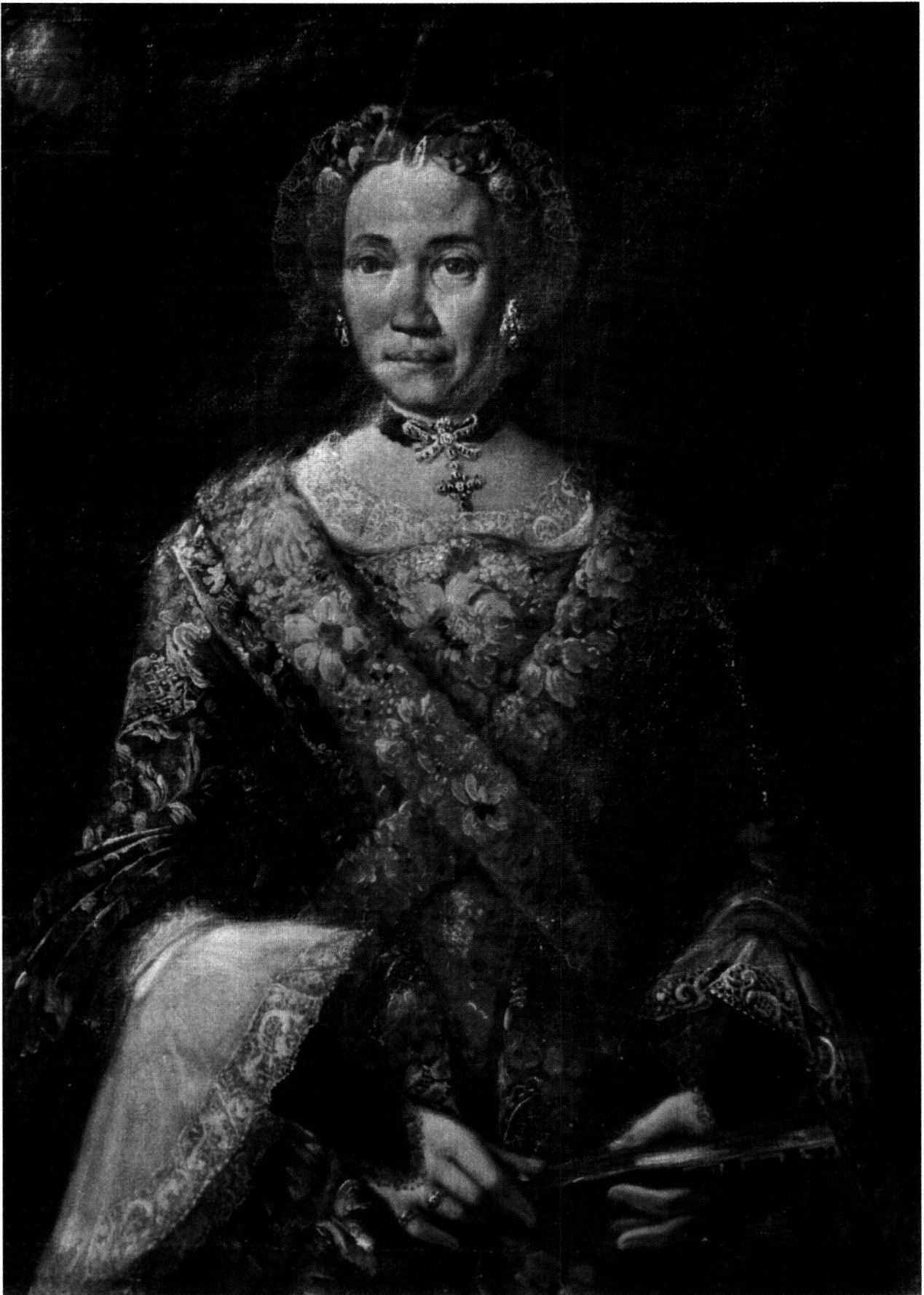
Il ritratto dell'«Infelice Dama», Poschiavo, Hotel Albrici, olio su tela (95 x 72 cm), attribuito da M. Karpowicz a Fra Galgario che l'avrebbe dipinto tra il 1725 e il 1730