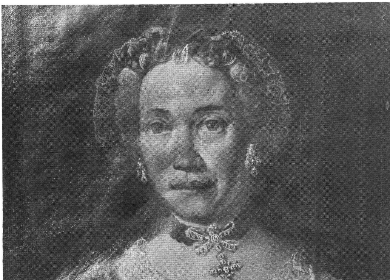
L'«Infelice Dama», particolare