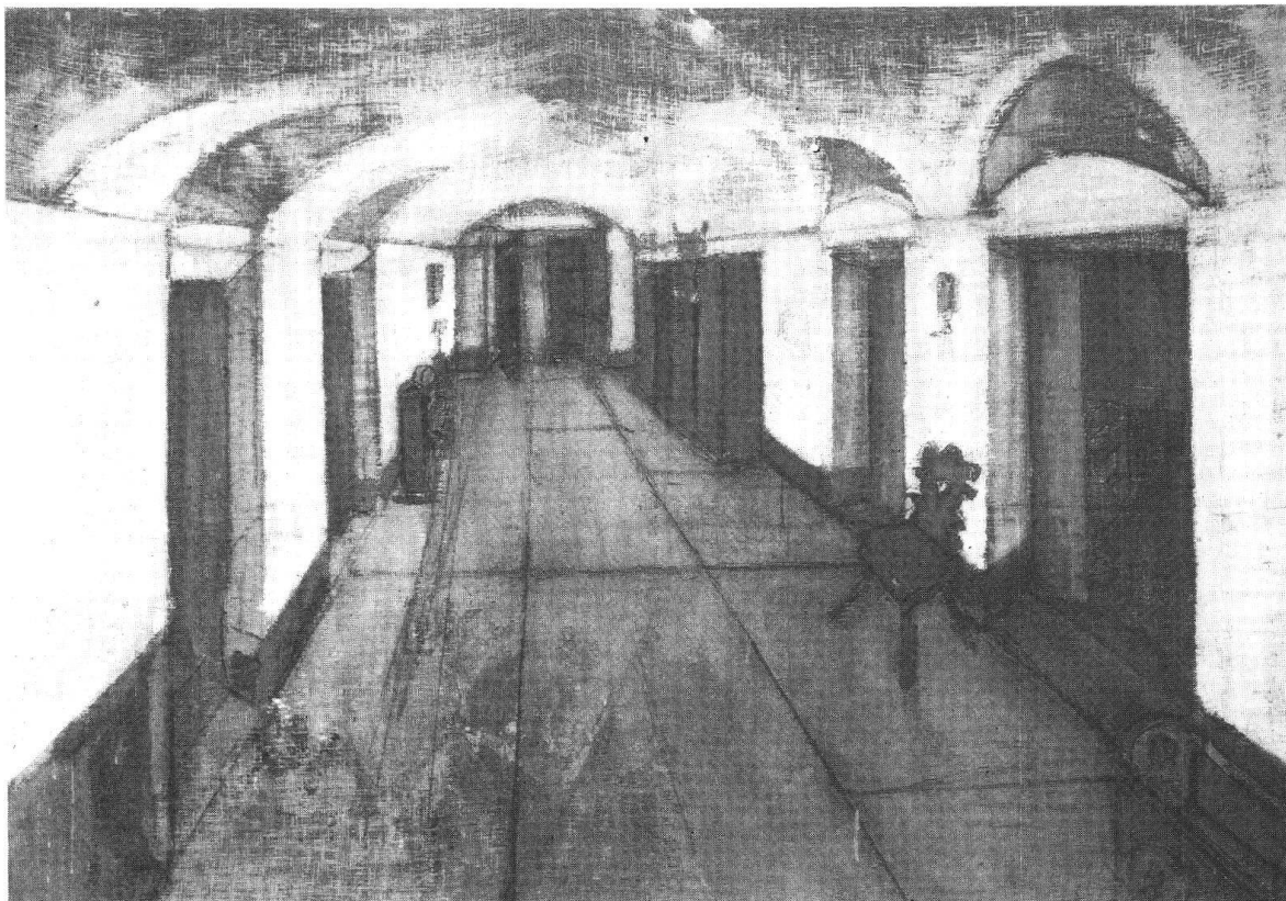
Corridoio a Bondo 1964, olio e carboncino su tela, 170 x 216 cm

Nei loro confronti, Varlin ha avuto il doloroso e sudatissimo vantaggio d'aver penato infinitamente di più a raggiungere la sommità; quella sommità cui Giacometti arrivò assai presto e dalla quale Bacon ebbe, addirittura, a partire. A questo punto, per farci meglio intendere, sembra utile rammentare la titolazione che il critico Max Eichenberger aveva dato alla prima mostra svizzera di Varlin (Zurigo, galleria Aktuaryus, 1943); esso, infatti, recitava: «Shakespeare o Charlie Chaplin?».