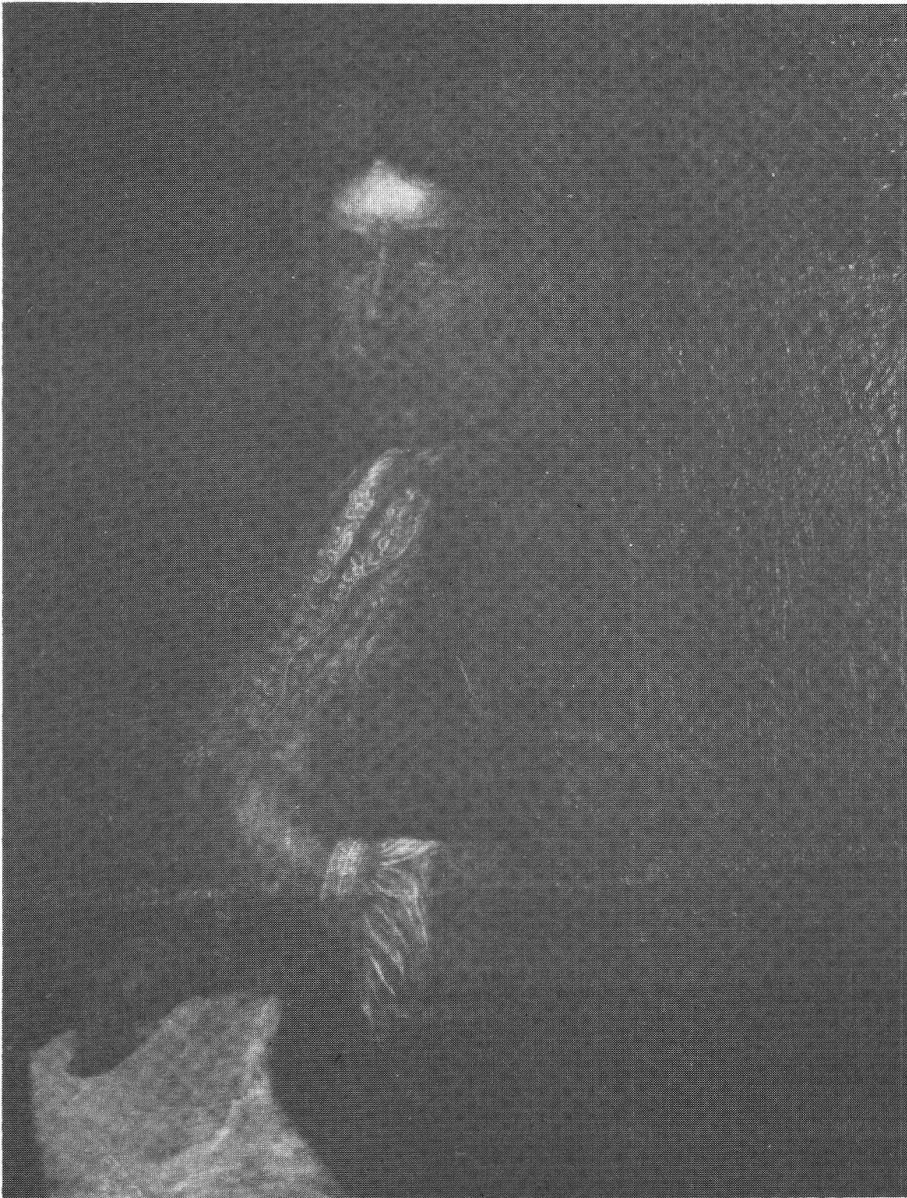
L'Architetto Antonio Riva (1650? - 1714), Ritratto nella sala comunale di Roveredo

di Giovanni, che si era poi portata seco a Monaco e dalla quale aveva avuto almeno due figlie, morte però ambedue in ancor tenera età.