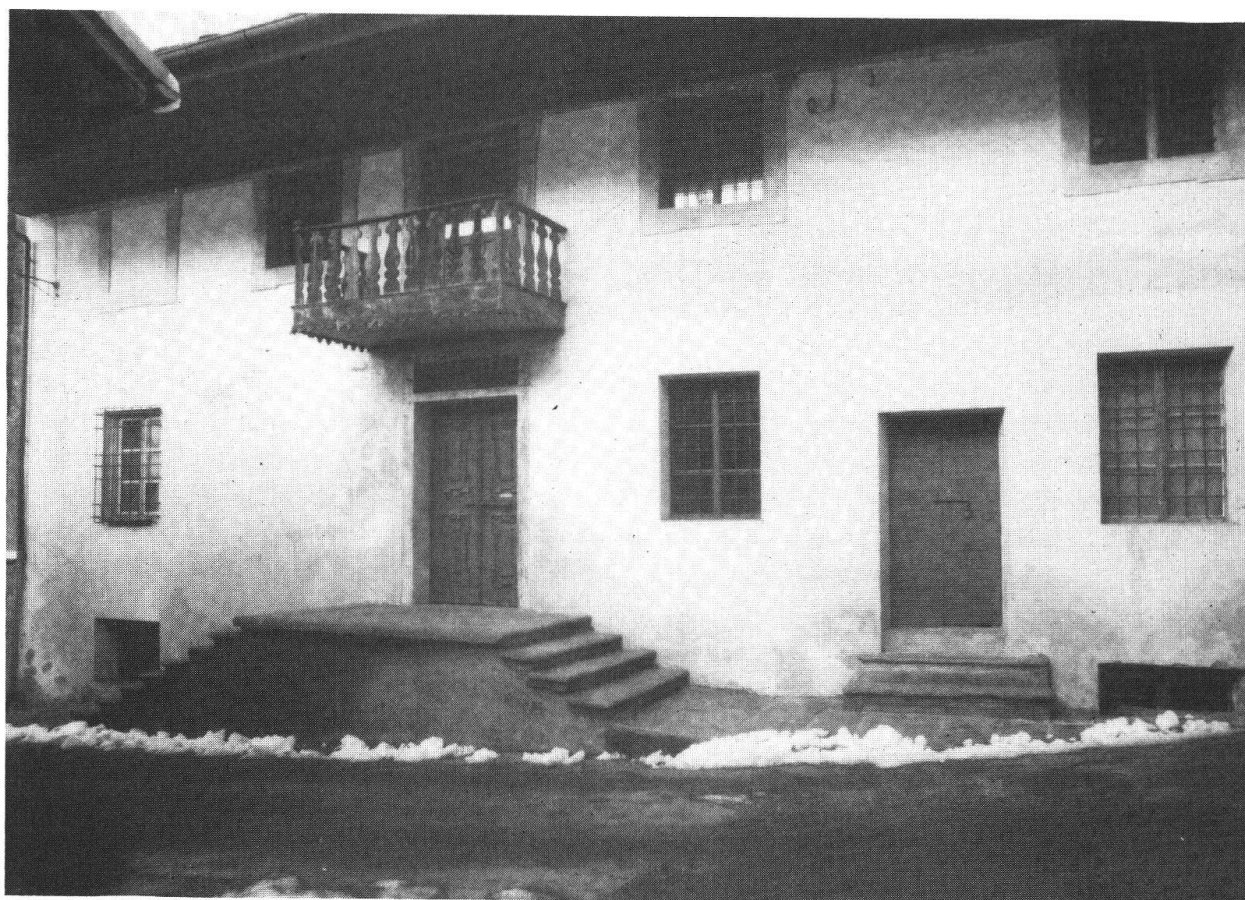
La «nuova casa Riva» o «Ospizio Riva» nella Degagna di Campagna, ora Frazione di San Giulio, a Roveredo, sede della prima scuola popolare roveredana (1718-1846)