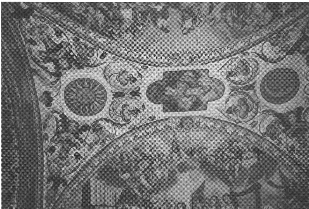
Johann Jakob Rieg, Darvella, S. Giuseppe, 1702

L'effetto cangiante negli abiti è un'ulteriore specialità di J. J. Rieg. A Cauco sono i mantelli rossi di S. Gregorio Magno , di S. Gerolamo oppure dell' Evangelista Marco (e in origine probabilmente anche di Giovanni l'Evangelista conservato solo ancora frammentariamente) che hanno delle ombre blu.