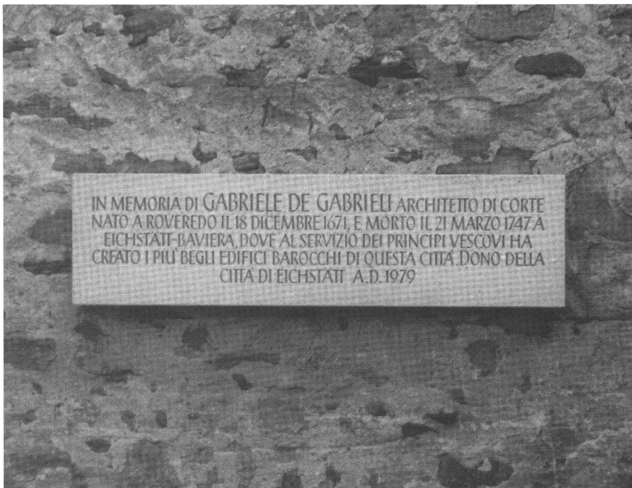
Lastra commemorativa posata nel 1979 sul muro accanto all'entrata della casa De Gabrieli a Roveredo.

Al terzo scontro un gran rumor s'aggira; Là giacere un cavallo e girne errante, Un altro là senza rettor si mira.