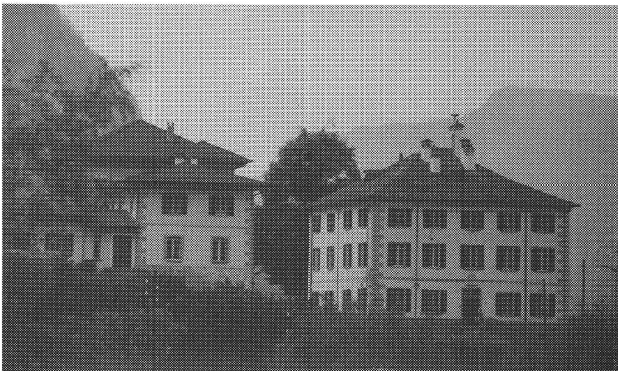
A destra: Il «Palazzo Comunale» edificato dal Comune nel 1856 e sede da allora fino al 1990 delle Scuole Comunali. Ora ospita ancora gli uffici dell'amministrazione comunale. A sinistra: la Casa Vairo, ancora attualmente sede della Scuola Materna. Dietro i due ultracentenari edifici pubblici troneggia tutt'ora il rigoglioso vecchio tiglio, piantato nel 1856 in occasione dell'inaugurazione del «Palazzo».

alla Chiesa, e di far riattare la Casa Vairo in Riva, adattabile questa poi quale edificio scolastico comunale.