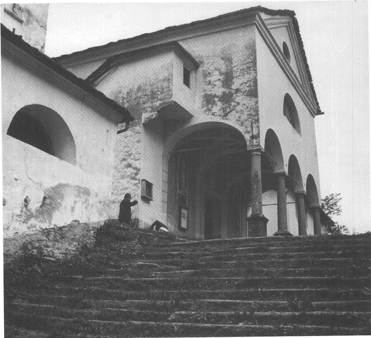
Chiesa di S. Bernardo a Rossa