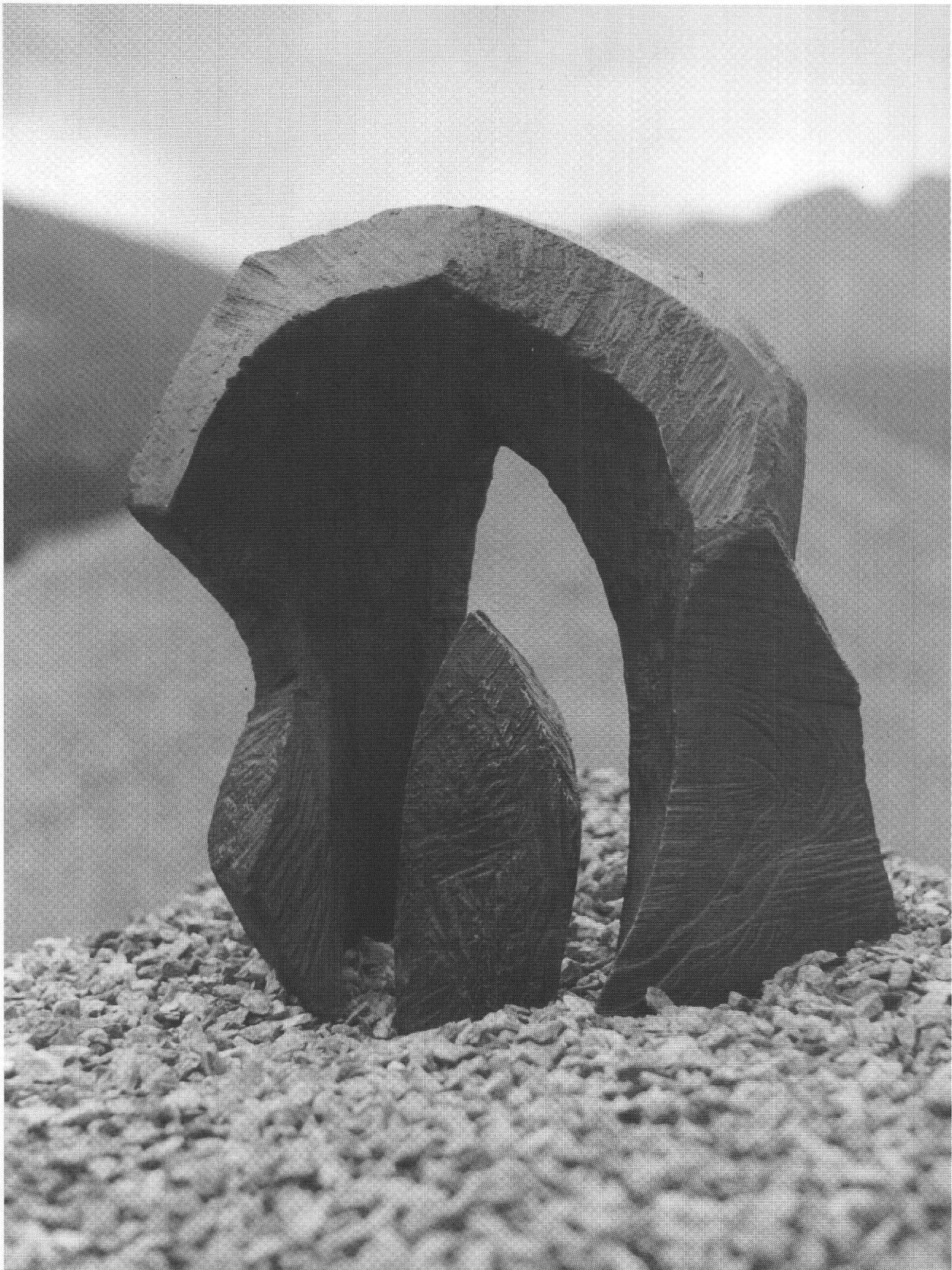
Not Bott, «Passaggio», 1991, bronzo, 41 cm.