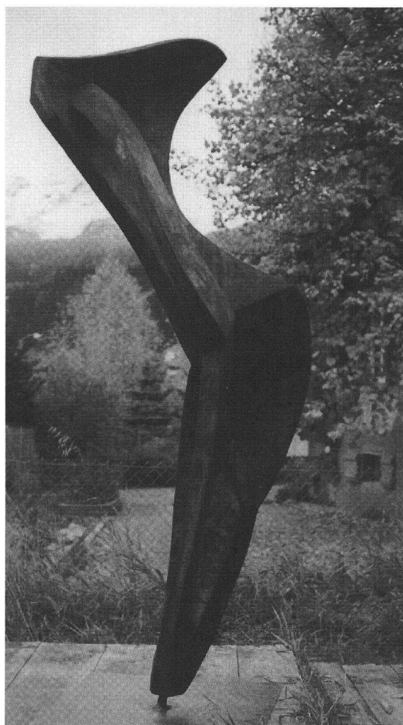
Not Bott, «Posa», 1990, cembro, 225 cm.