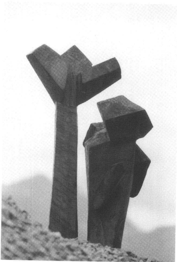
Not Bott, «Viandante», 1992, cembro, 56 cm.