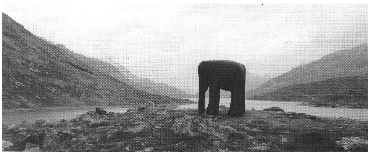
Not Bott, «Elefante», 1992, castagno, 115 cm.