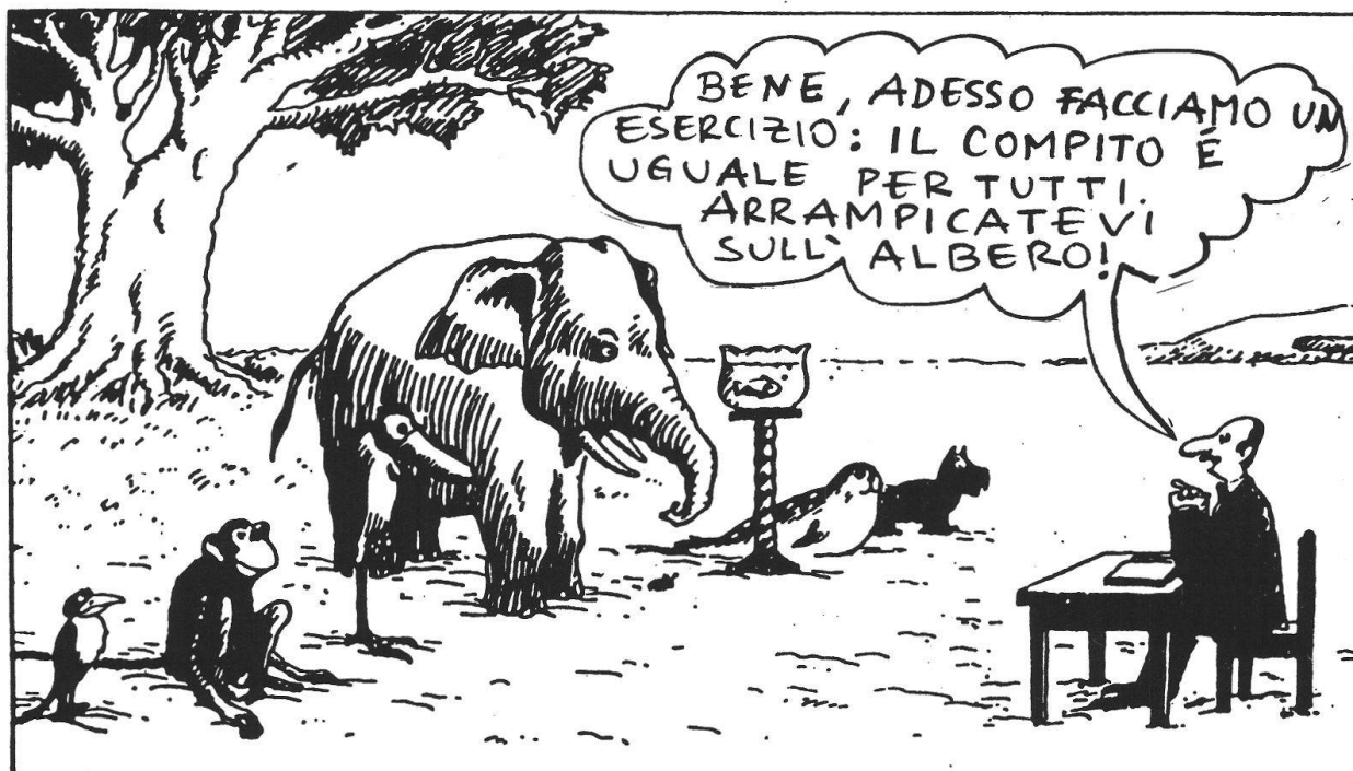
Illustrazione 1 - La finzione dell'omogeneità delle classi

ripercuotono nei risvolti statistici piú recenti (riportati sopra).