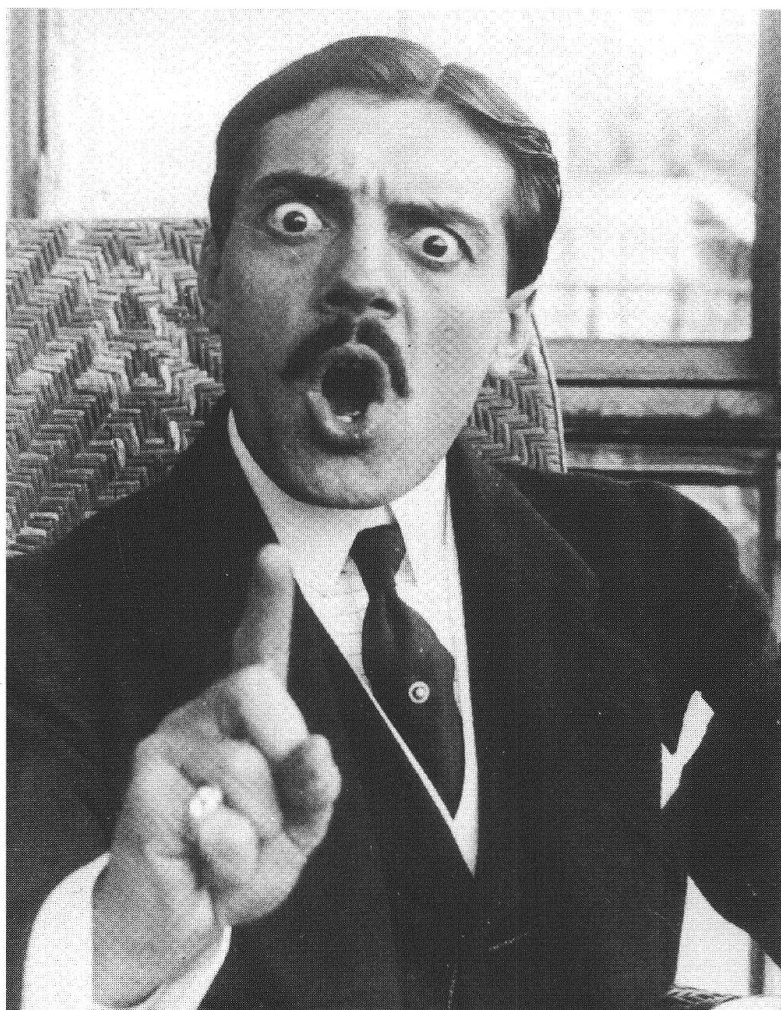
Il comico francese Max Linder

Cinema-Teatro. — Le rappresentazioni cinematografiche attirano sempre buon numero di spettatori. Domenica 4 pom. vi fu una matinée, a prezzi ridotti, per il mondo piccino, che ebbe campo d'istruirsi e di ridere saporitamente. Le scene esilaranti del famoso Max Linder sono naturalmente quelle che maggiormente dilettono i bambini.