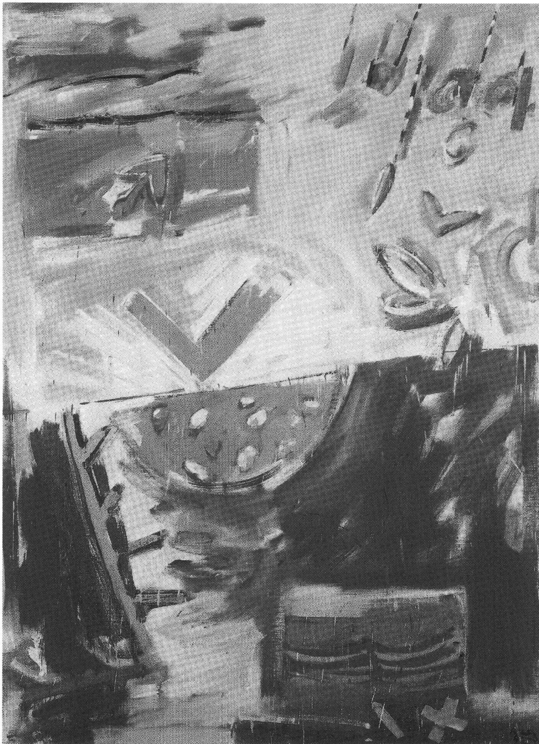
«Senza titolo» 93/2 olio su tela, 190 x 135 cm, 1993 proprietà Hoffmann-La Roche, Basilea