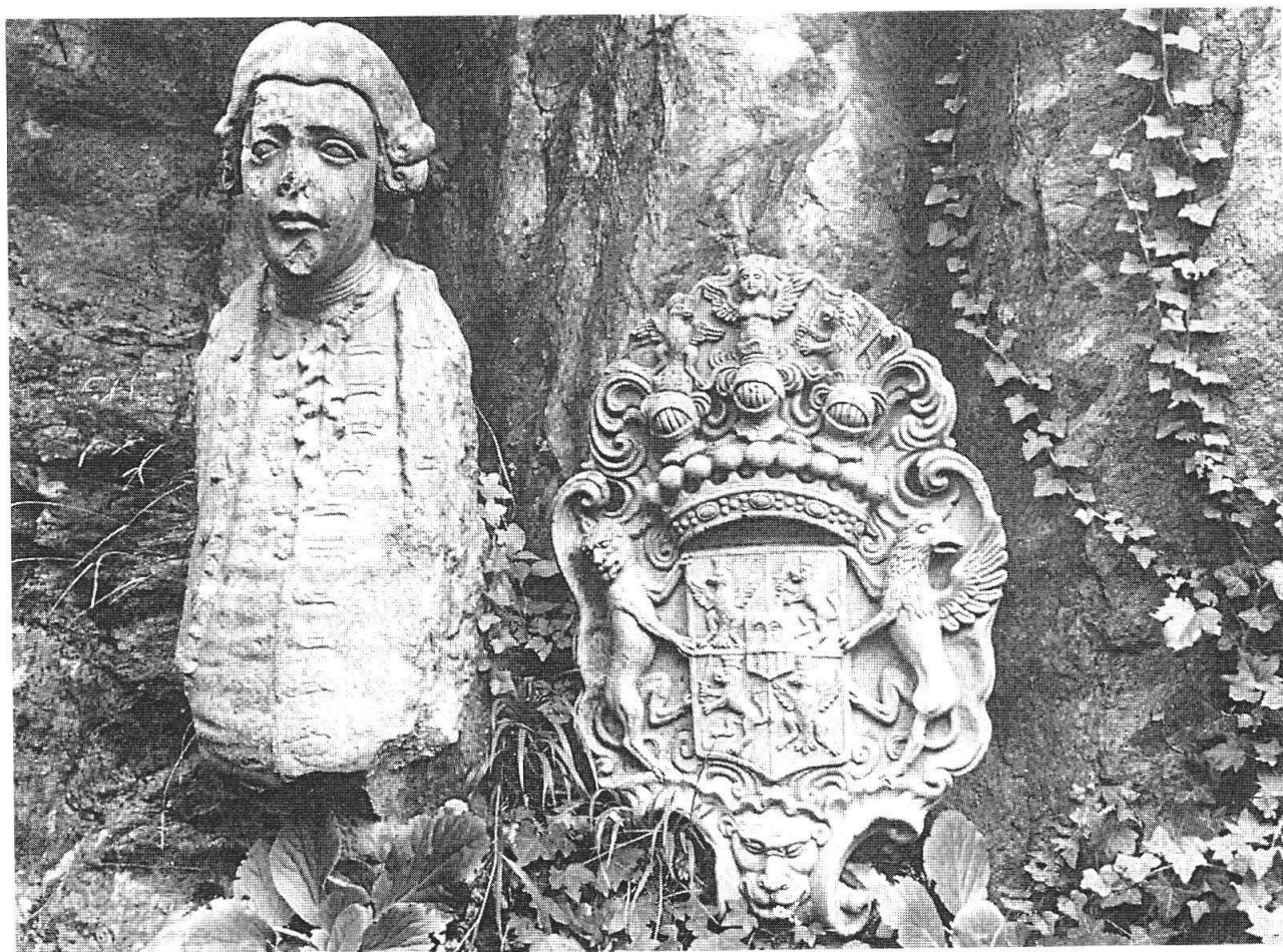
Chiavenna, Museo del Paradiso, avanzi della statua di Pietro Salis Soglio, governatore e capitano di Valtellina, con relativo stemma in pietra ollare (1782), già sulla fontana di piazza Pestalozzi

Riportiamo il programma del convegno del quale non sfuggirà l'importanza determinata dagli argomenti e dalla qualità dei relatori.