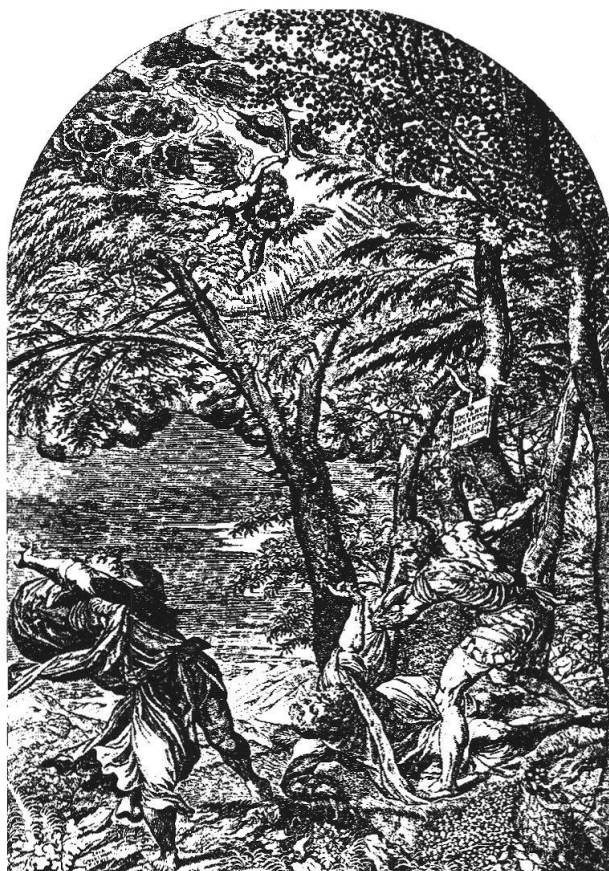
A destra: Morte di S. Pietro Martire , stampa da Tiziano

Pietro, il momento in cui l'aggressore lo getta in terra e gli infigge il colpo mortale con la spada. Il cattivo stato di conservazione e la vernice sfuocata non ci permettono di stabilire se la stessa mano ha eseguito questa ultima tela. Conosciamo infatti l'autore delle due tele precedenti, essendosi conservata la ricevuta: era stato Pietro Ghezzi di Val Carmine presso Lugano 38 . Si è eternizzato anche il fondatore: su ambedue le tele in basso, con chiare lettere maiuscole, leggiamo «Stefano del Zoppo ha fatto fare 1683».