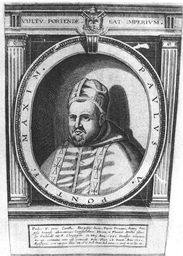
Paolo V Borghese. Stampa del 1621