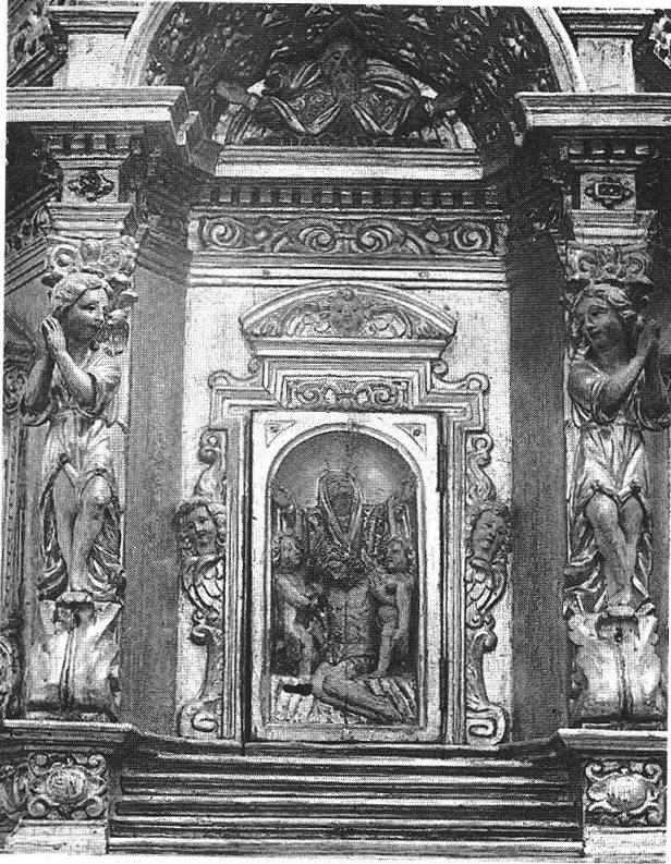
Sopra: S. Domenica in Calanca, tabernacolo, parte centrale.