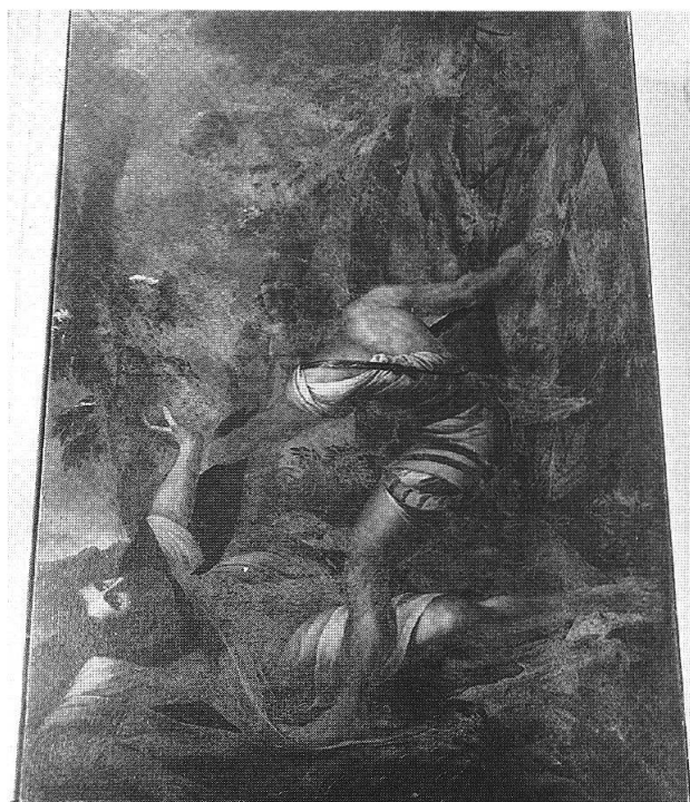
Sopra: S. Domenica in Calanca , cappella laterale, Morte di S. Pietro Martire