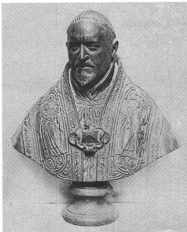
G.L. Bernini, Busto di Paolo V , Roma, S. Maria Maggiore

Simili categorie di ripresa istantanea del ritratto sono state applicate dall'autore nella seconda erma nel reliquiario di S. Giustino Martire. Nell'armatura di soldato romano, con la testa nuda circondata dall'aureola, il santo cavaliere è il ritratto dell'imperatore Ferdinando II. I baffi, il ciuffetto di barba al centro del mento, il naso diritto e lungo, tutto ciò è caratteristico per i lineamenti del volto dell'imperatore asburgico (1578-1637). Inoltre il costume antico, quell'armatura romana con le spalline a leone e le strisce delle corregge dette «pteryges» nonché la somiglianza con le effigi degli imperatori romani, sono un elemento stabile dell'iconografia asburgica. Sviluppata particolarmente alla corte di Rodolfo II, questa maniera «all'antica» era passata successivamente agli imperatori del XVII secolo. Era un ottimo modo di glorificare, di porre in rilievo l'antica tradizione imperiale e le pretese al potere supremo su tutta l'Europa, che gli Asburgo si riconoscevano. Ferdinando II era più volte rappresentato come antico imperatore 16 . Nel nostro caso aveva dovuto servire come falsariga una delle stampe dell'effigie di Ferdinando in costume antico.