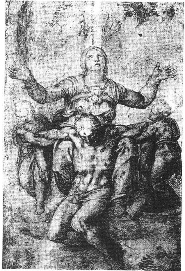
A destra: Michelangelo, Pietà, disegno. Boston, Isabelle Stewart Gardner Museum.

c'interessa di meno. Presenta infatti la composizione invertita nei confronti del disegno di Michelangelo, mentre il nostro rilievo di Santa Domenica ha un decorso conforme al disegno del maestro, come del resto le due prime incisioni. Si può pertanto supporre che il nostro scultore o aveva davanti agli occhi un suo disegno della composizione di Michelangelo, oppure si era servito di una delle incisioni soprariportate.