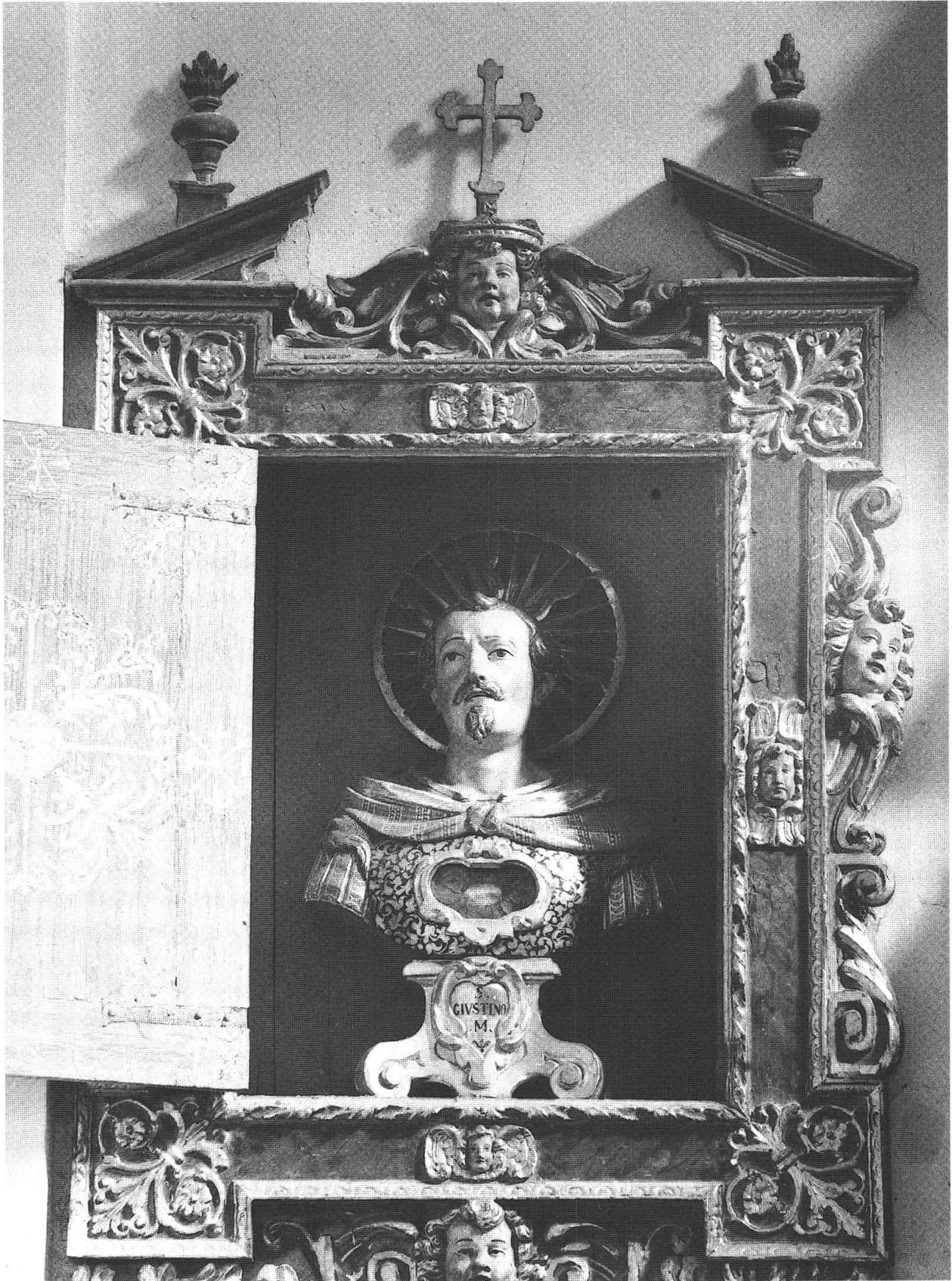
S. Domenica in Calanca, busto di S. Giustino