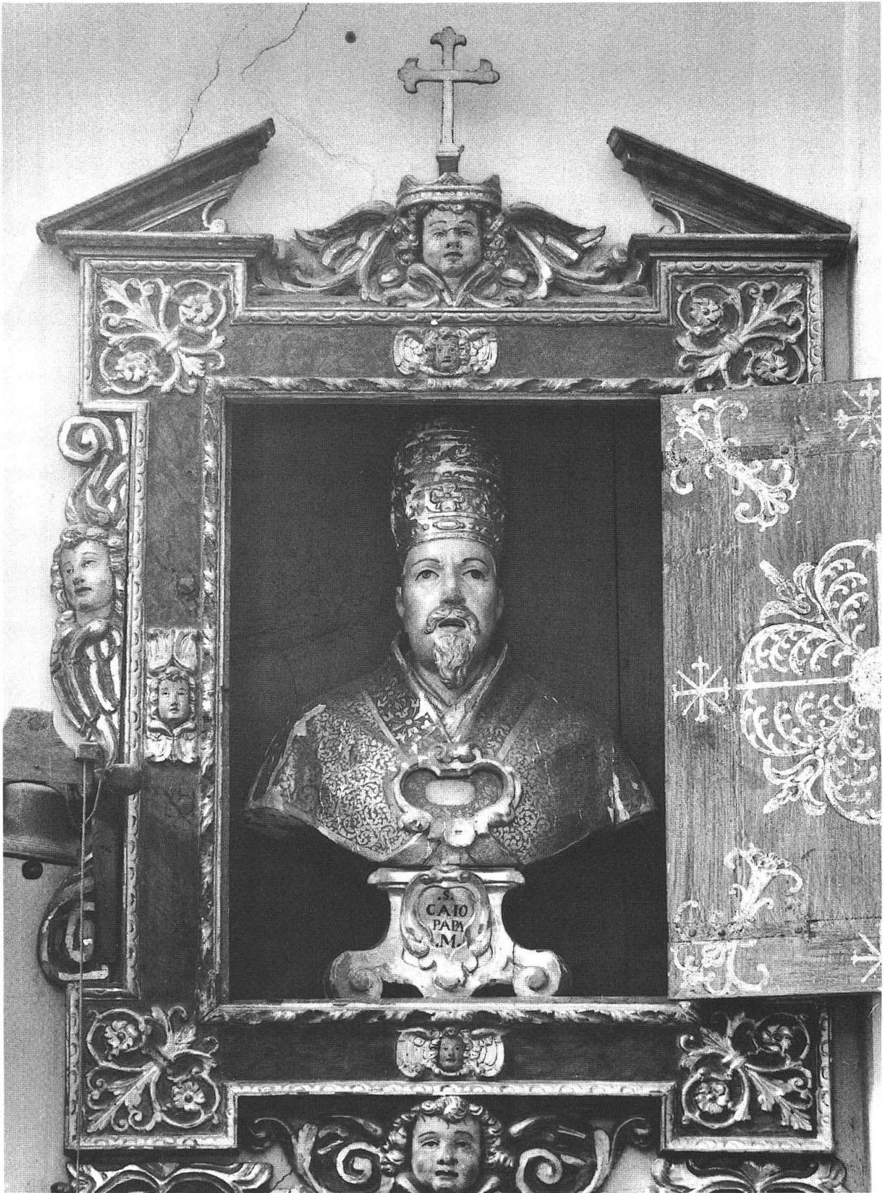
S. Domenica in Calanca, busto di S. Caio Papa.