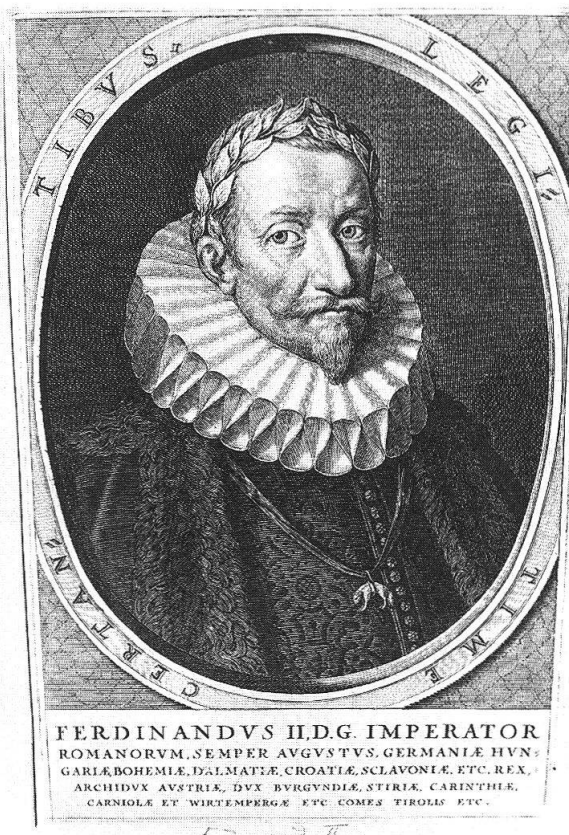
Ferdinando II Imperatore. Stampa d'epoca.

Se pertanto gli autori dell'altare di Santa Domenica lo hanno fornito delle effigi del papa e dell'imperatore, dovevano avere uno scopo politico. Volevano dimostrare le due massime autorità del mondo cattolico, di quel mondo che proprio nel 1620 aveva riportato la schiacciante vittoria sui protestanti alla Montagna Bianca. Quali erano i condizionamenti locali delle circostanze e dei motivi, sarà raccontato particolareggiatamente dal mio amico Cesare Santi, intenditore della storia di questa regione. Noi dobbiamo soltanto aggiungere che, a partire dal XVI secolo, una simile «attualizzazione» delle effigi era un fenomeno affatto frequente, che aveva di regola un'eloquenza politica. Per esempio, nel grande affresco nella Sala Reggia in Vaticano, opera di Giuseppe Porta – la resa di Federico Barbarossa ad Alessandro III – il papa medioevale presenta i lineamenti dell'allora attuale papa Pio IV 17 . Lo stesso avviene negli affreschi di Raffaello. Gli esempi si potrebbero moltiplicare. Gli autori dell'altare di Val Calanca si erano pertanto richiamati alla tradizione romana ben radicata.