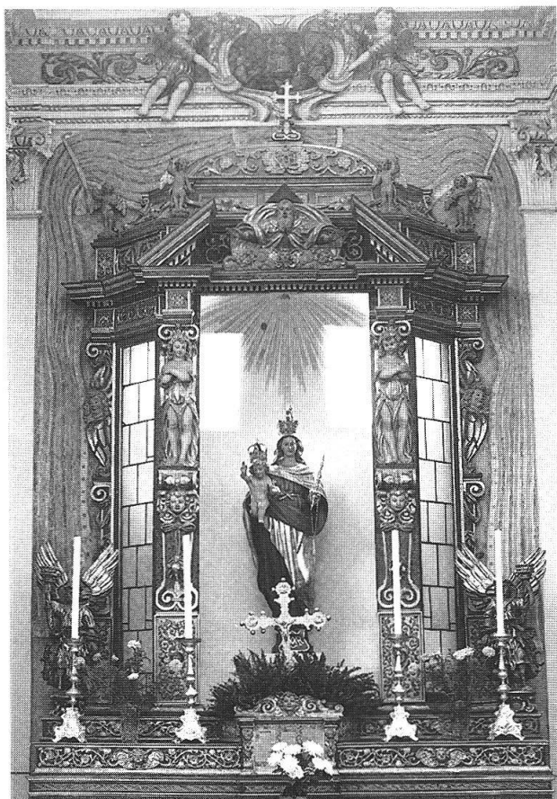
Sopra: S. Domenica in Calanca, altare della Madonna