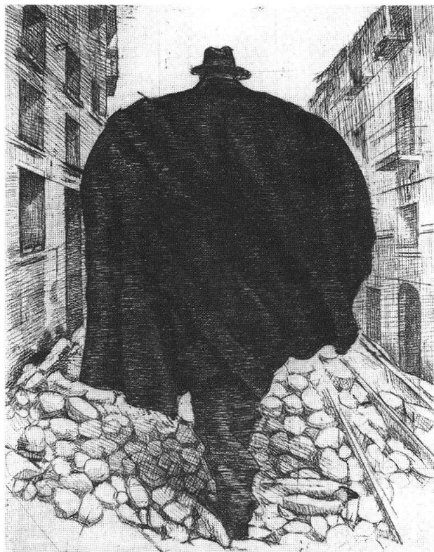
M. Rossi, «Uomo con mantella», 1975

L'alternanza, pittura-incisione, che ha sempre caratterizzato il suo operare espressivo, evidenzia, ancora una volta, quella sua natura così distinta, così esigente, così inesorabilmente ferma, sia nell'esecuzione «in cavo», sia nell'ideazione «lineare», che anche la sua pittura sottolinea.