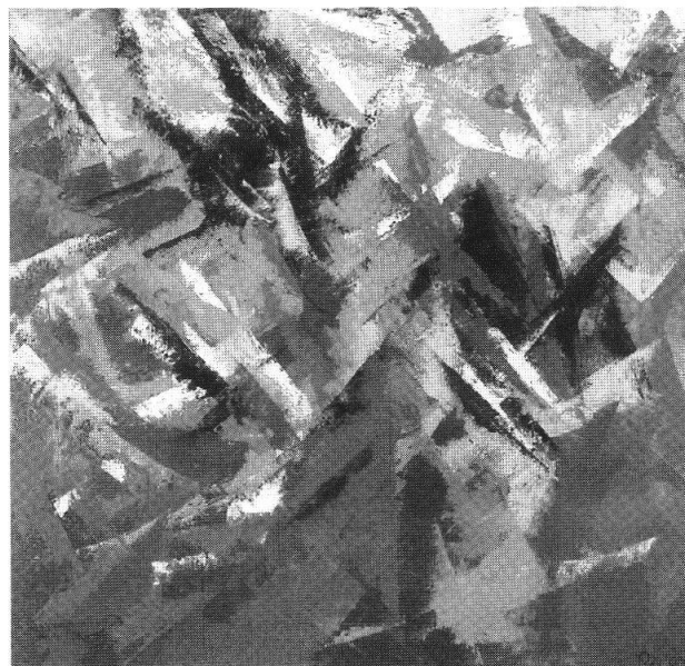
«Astrazione», 1999, olio su tela

Basti ricordare le rutilanti falciate di Kräftepiel (1999) o di Kontraste (1993), giocate sul grigio; gli amalgami interiorizzati blu-rossi bruciati sul nero carbonato di