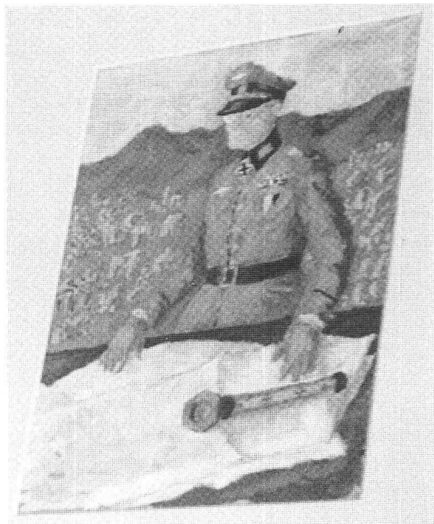
«Feldmaresciallo» 1996, tempera