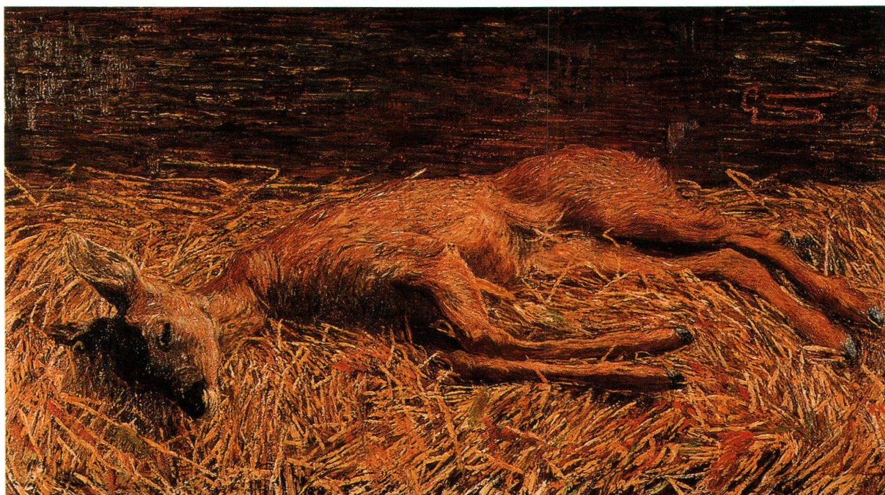
Capriolo morto, 1892, Museo Segantini, San Moritz

Segantini, che passava da uno stato di collasso all'altro, morì il 28 settembre le ore 11 e 20 minuti di sera. Ho personalmente assistito l'ammalato giorno e notte.