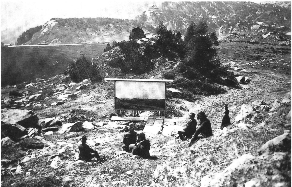
Giovanni Segantini con alcuni amici davanti al pannello centrale del Trittico, Maloja, 1898

Soglio 28-II-98 Caro Giacometti. Ho ricevuto la Vostra lettera e vi posso dire che il progetto del panorama è andato in fumo definitivamente. Sono contento che voi e Amiet lavoriate e stiate bene e che ricordiate qualche volta il Vostro G. Segantini