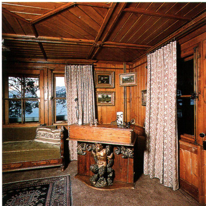
Interno della Casa di Segantini a Maloja/Maloggia

La capacità di comunicare, non importa in che lingua e con quale tipo di persona, e il piacere per la vita, contribuirono decisamente alla fama di Segantini che, a partire dall'età di 35 anni, era già uno degli artisti più quotati d'Europa. Il tempo che impiegava per le relazioni sociali qualche volta andava a scapito del tempo riservato alla pittura. A tale proposito Segantini scrive ad Alberto Grubicy di non dire agli amici milanesi che sarebbe venuto a Milano perché non voleva essere disturbato. Avrebbe avuto solo bisogno di un locale tranquillo per lavorare. Grubicy, in un'altra occasione, preoccupato, accenna a quanto sarebbe importante, per Segantini, abitare nel Castello Belvedere a Maloja in modo da «tenersi lontano da molte molestie».