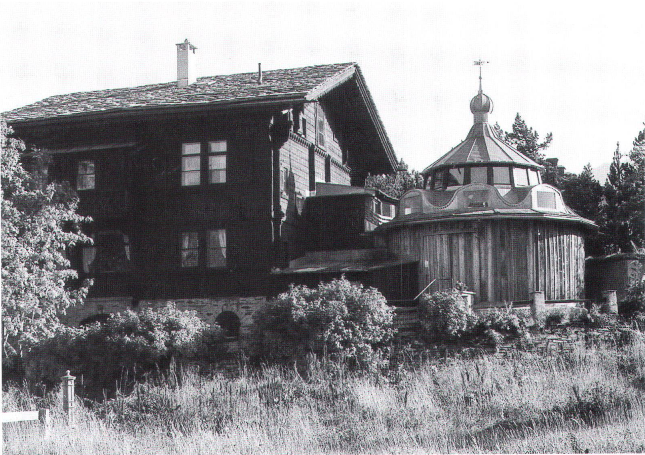
Maloja, la casa di Segantini con l'atelier