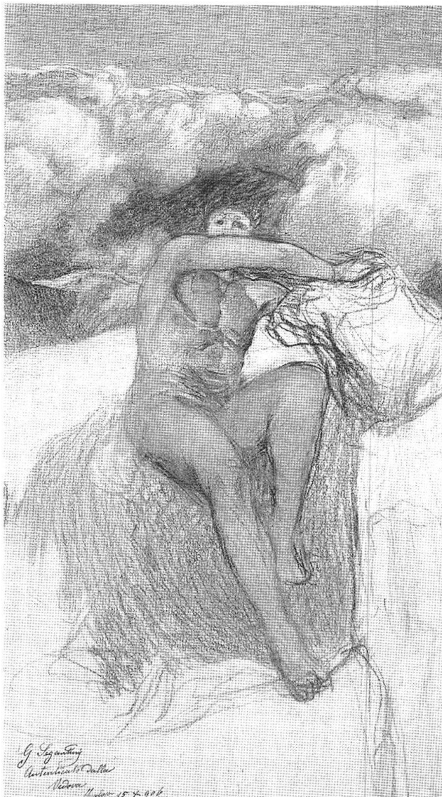
La valanga, probabile studio per il medaglione destro de La vita, [1899], Museo Segantini San Moritz

Segantini, nell'intrico scandito dal ritmo (creatività, personalità, forma dell'opera), assomma, di volta in volta, un'interpretazione del «vivere-in-prossimità» 29 d'istinto prima che culturale, perché non è importante il «che cosa» (montagna-bottiglia/scolabottiglia-oggetto trovato o assemblato), ma è importante il «come», cioè come egli inventa il suo linguaggio strutturalmente codificato e la panica partecipazione della sua Einfühlung .