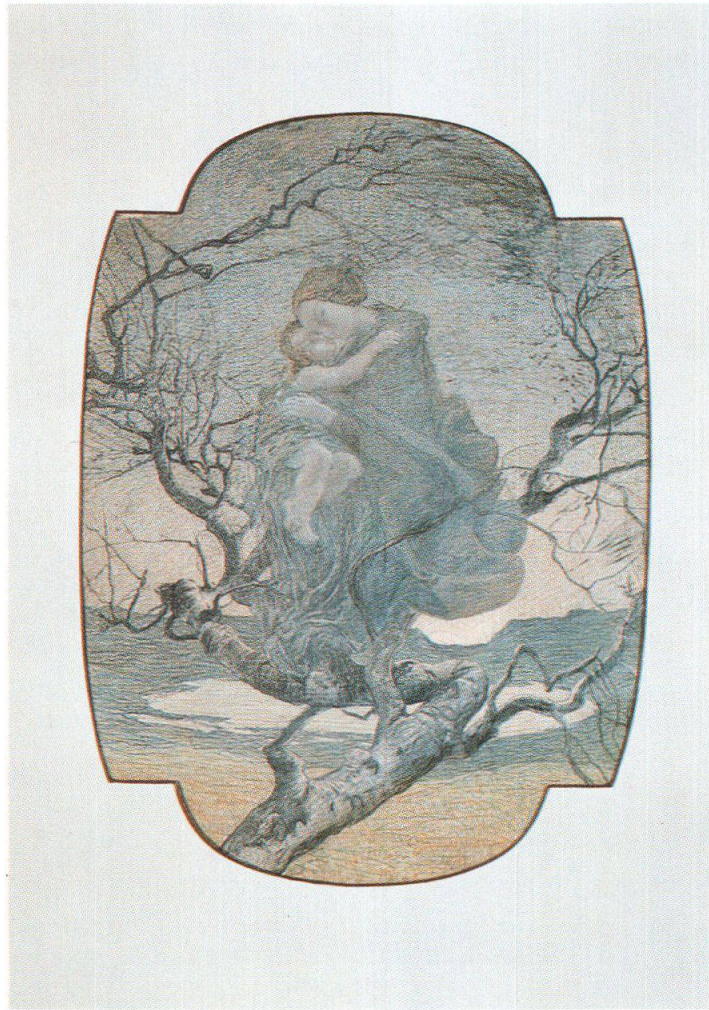
L'angelo della vita, 1892, Museo Segantini, San Moritz

Il riflesso simbolico è dunque legato al reale, indissolubilmente. Ancora una volta Segantini dimostra di sapersi tenere perfettamente al passo coi tempi e con le nuove tendenze europee: non è più tempo di naturalismo, incapace di superare la mera realtà visibile, bisogna ricercare oltre quei confini già indagati e oramai privi di fascino. L'approccio di Segantini al mondo immaginario e simbolico è decisamente originale, ma il dubbio che tale mondo non gli sia congeniale sfiora non pochi studiosi. Essi avvertono un'estraneità, un'insicurezza nascosta in gran parte delle opere simboliste del maestro. È Segantini realista che amano, che ammirano.