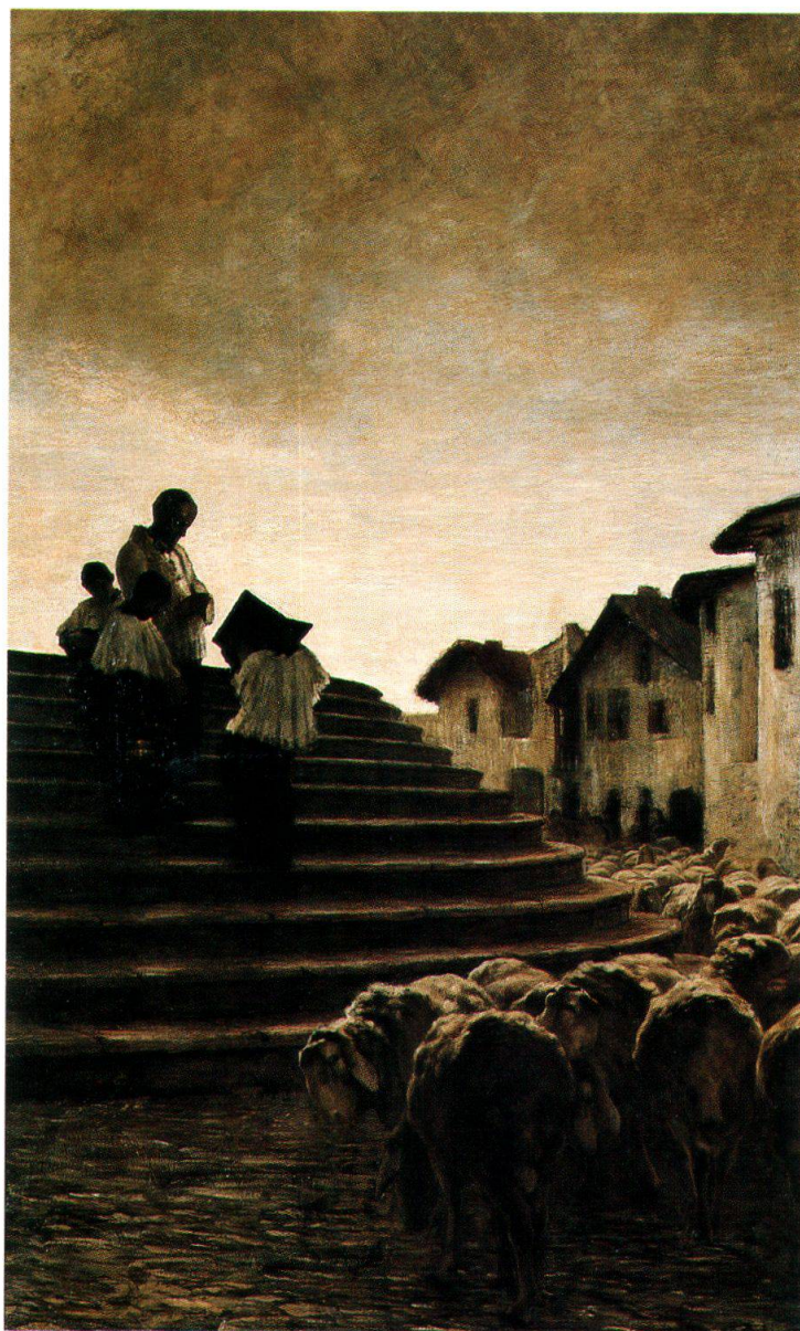
La benedizione delle pecore, [1884 ca.], Museo Segantini, San Moritz

È l'amore di Segantini per la verità che cattura principalmente l'ammirazione dei critici.