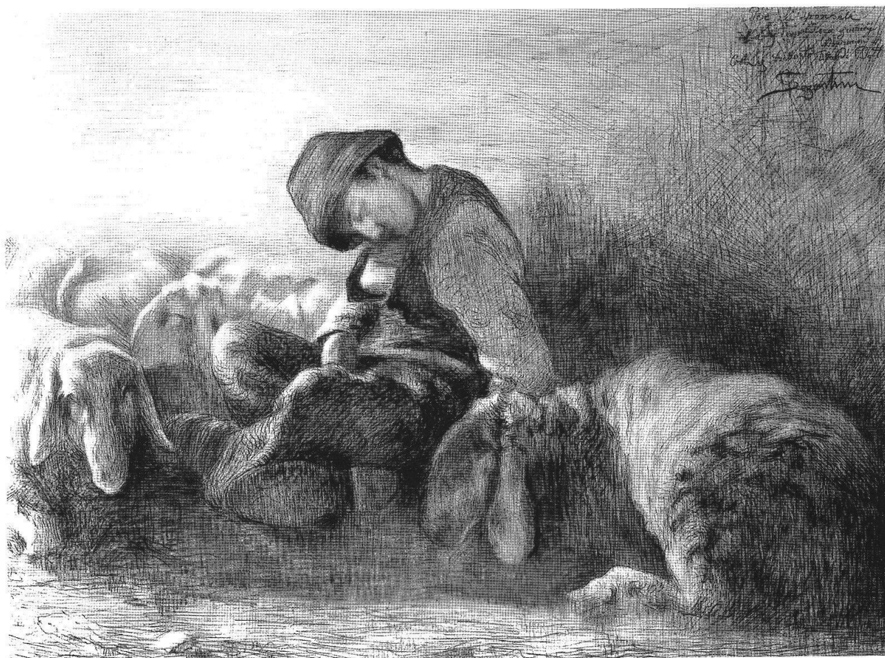
Pastore addormentato , [1882], Museo Segantini, San Moritz

Il ciclone portato dalle avanguardie non ha investito solo la realtà indagata ma anche, e soprattutto, la sensibilità ottica e percettiva di pubblico e critica. E proprio su questo vale la pena soffermarsi. Segantini – confrontato con le opere dei più giovani artisti europei – non fu più considerato moderno e innovatore. Mentre continuava ad essere amato dal grande pubblico, la critica più colta fu assorbita dalle novità sconvolgenti che il mondo dell'arte produceva ad una velocità straordinaria. Ogni nuovo secolo tende sempre a considerare sorpassato in tutti i sensi il precedente. Se Segantini fosse vissuto più a lungo, avrebbe probabilmente seguito – sempre a modo suo – il nuovo linguaggio dell'arte europea e mondiale. Avrebbe adattato il suo percorso alle istanze della modernità, rispettando sempre però i suoi incrollabili principi. Segantini, infatti, non ha mai smesso di seguire da lontano gli avvenimenti artistici a lui contemporanei. Si è parlato troppo di lui come un artista totalmente isolato dal mondo: ciò non risponde a verità. Segantini leggeva e si documentava, incontrava persone da tutta Europa 4 , intesseva amicizie con cui scambiare le proprie opinioni. Per questo non sarebbe rimasto estraneo all'arte in evoluzione.