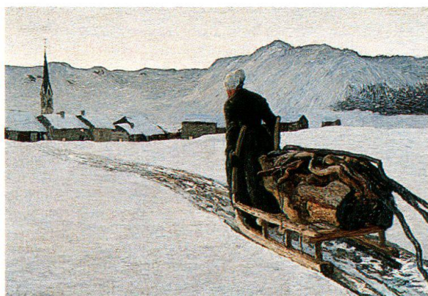
Ritorno dal bosco, 1890, Kunstmuseum, San Gallo