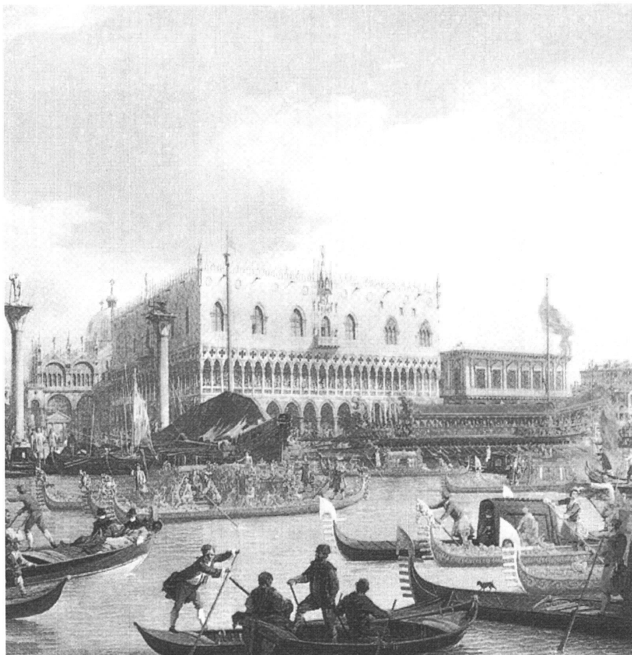
Canaletto, Sposalizio del Doge e del mare, particolare

E con Monteverdi, maestro di cappella di San Marco (1613) la scuola veneziana porterà un contributo formidabile allo sviluppo del melodramma. Il San Cassiano fu il primo teatro pubblico che si aprì all'opera in musica (1637), e Venezia divenne ben presto in tal campo il primo mercato artistico d'Europa.