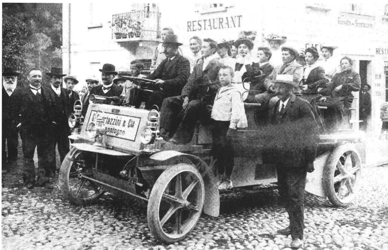
Storia dei Grigioni, Una delle prime automobili del mulino Scartazzini (Promontogno) a Castasegna , Vol. III, p. 72

da forti sconvolgimenti di carattere religioso-politico che lo costringeranno a rivedere le relazioni con la casa d'Austria a proposito dei territori sottomessi. La Rivoluzione francese «castiga» doppiamente le Tre Leghe: prima le priva della Valtellina (1797) e poi le fonde nel Canton Rezia (1798) per incorporarle nella Repubblica Elvetica. Tuttavia la fine ufficiale del Libero Stato sarà decretata nel 1803 con l'adesione alla Confederazione che non comporta però cambiamenti economico-sociali rilevanti per il nuovo Cantone.