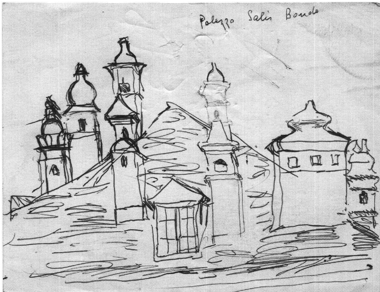
Varlin, Palazzo Salis di Bondo, ca. 1970, penna a sfera su carta, 13.7x17.8 cm, collezione privata