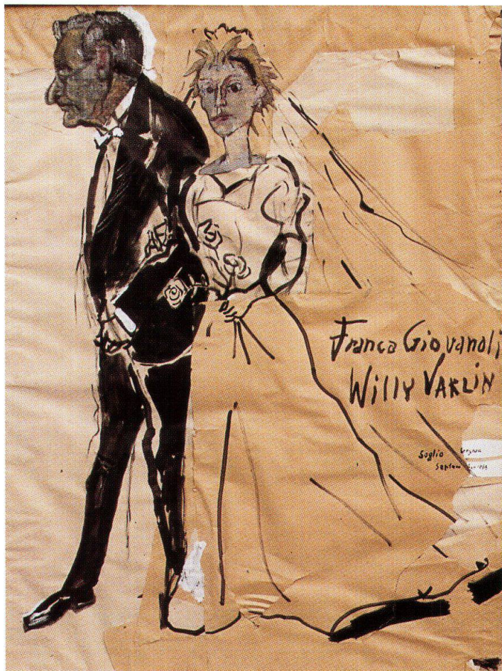
Varlin, Annuncio matrimoniale, 1963, olio, carboncino, guazzo su juta e carta d'imballaggio, incollati su tela, 91.5x67.5 cm (cat.1113), proprietà privata.