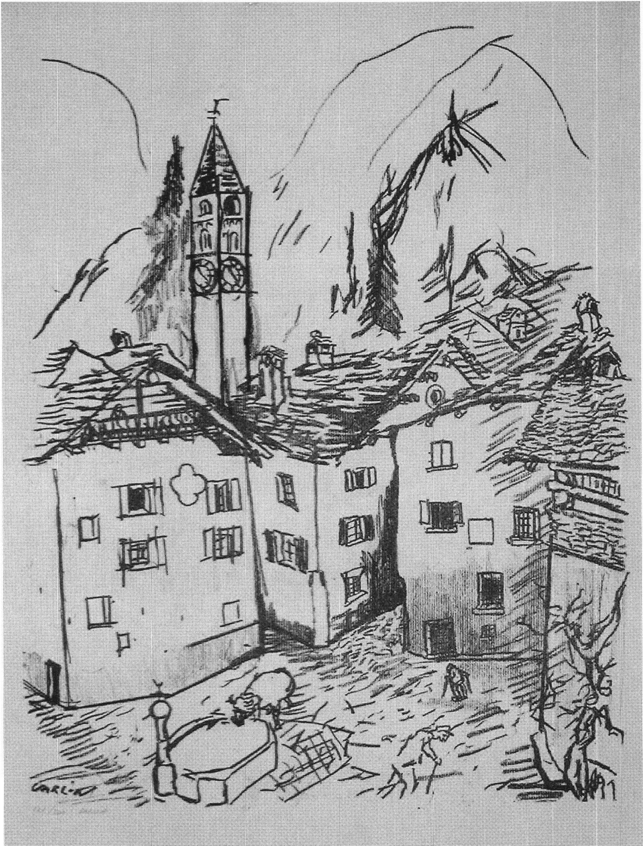
Varlin, Plaza Zott, ca. 1970, Litografia, 76x56 cm