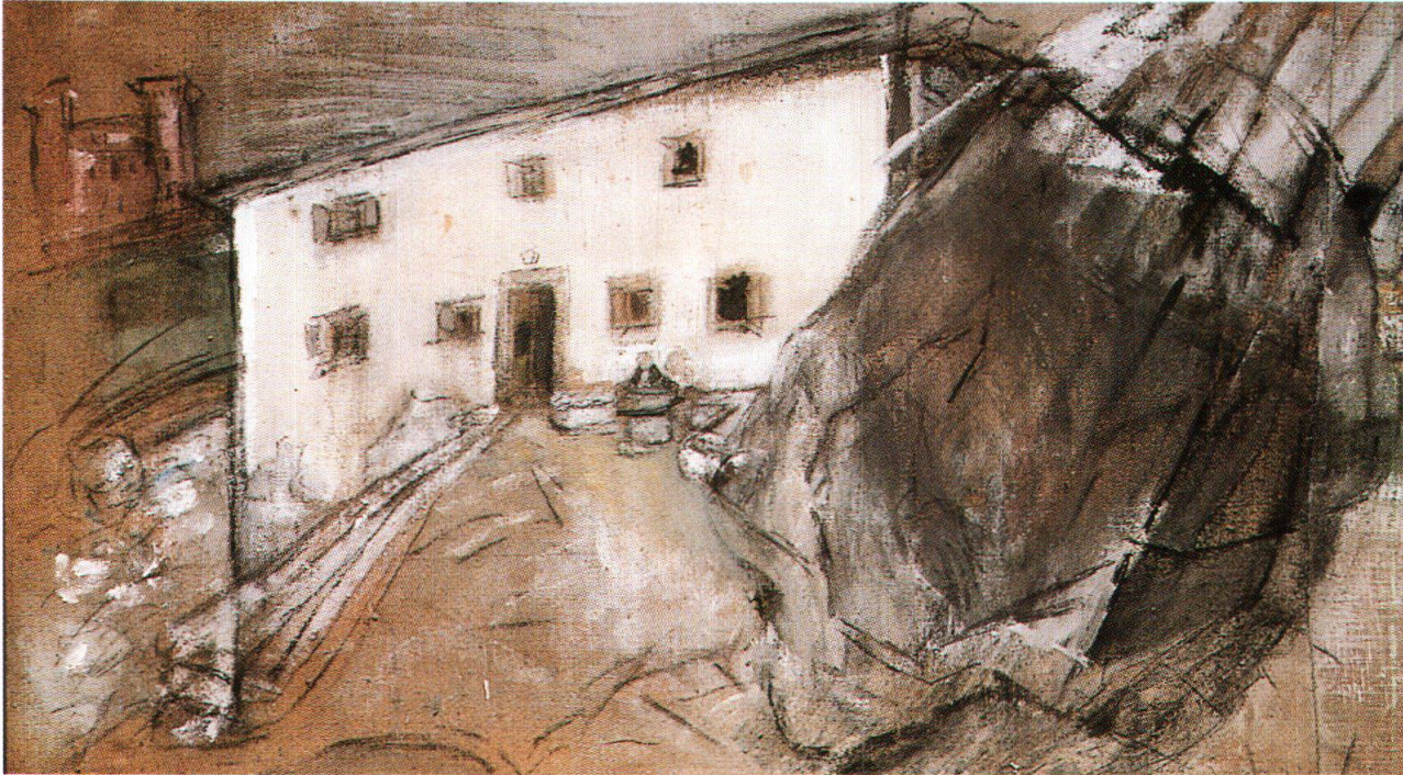
Varlin, Casa Palü a Stampa, 1970, olio e carboncino su tela, 100x170 cm, collezione privata (cat. 1261)

tale lo ha rappresentato Ludy Kessler nel suo film - si pensi alla spaghiettata orgiastica o ai quadri puliti nella lavatrice. Ma sono atti di dissimulazione. Ovviamente anche lui nascondeva dietro la maschera delle pagliacciate la propria sensibilità ferita. E di ferite ne ha subite, anche se solo raramente parlava del fatto di essere ebreo nella nostra società, e trattato come tale.