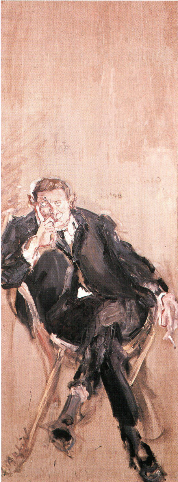
Varlin, Lo scrittore Dr. Hugo Loetscher, 1964, olio e carboncino su tela, 239x86 cm, collezione privata (cat. 1137)

per il mio sviluppo difettoso che aveva sfidato le muse. Il mio difetto indusse Varlin a dipingermi una seconda volta, un quadro che mi costò infinite sedute.