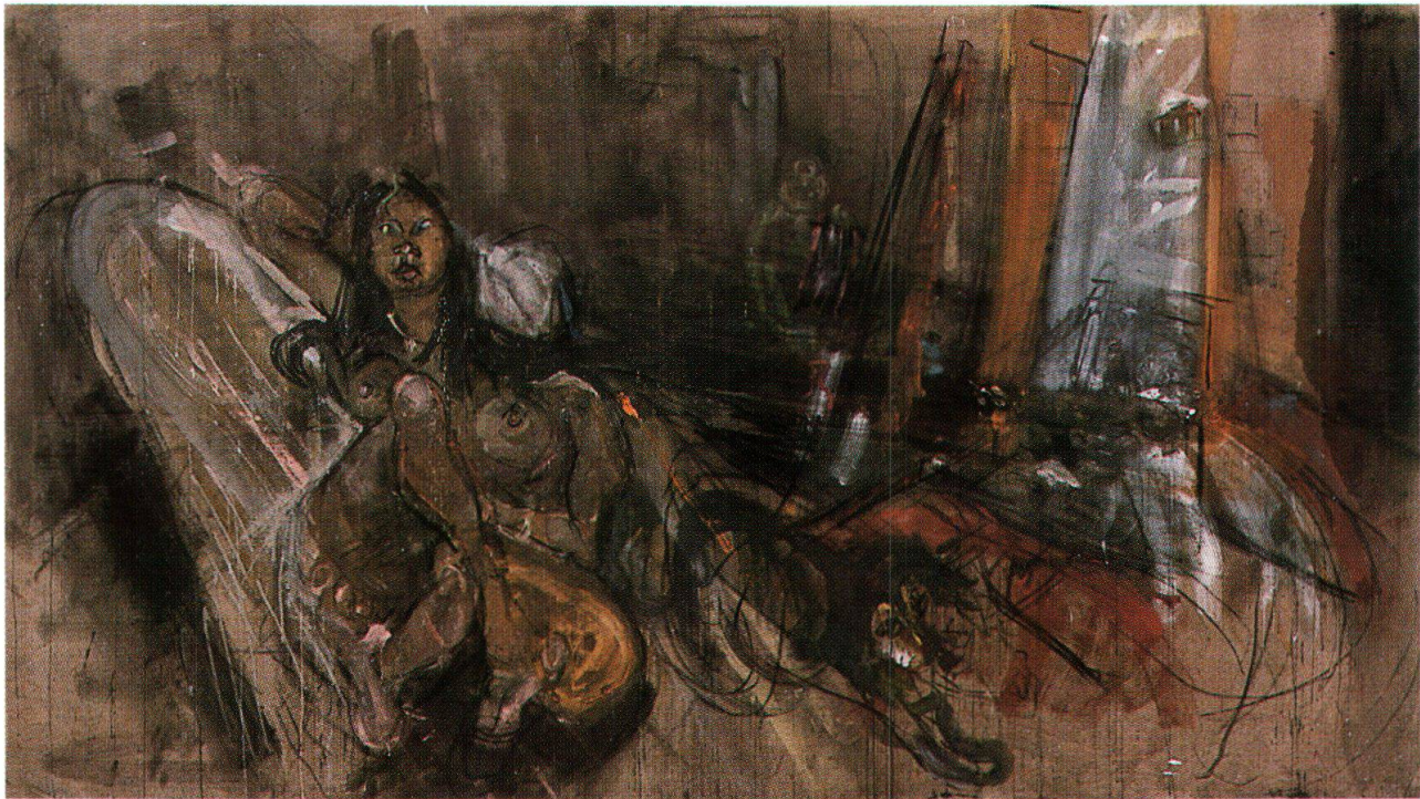
Varlin, La thailandese Tui-Tui nell'atelier di Bondo, 1973-74, olio e carboncino su tela, 170x300 cm, collezione privata (cat. 1349)

Si passa ancora una volta in rassegna tutto ciò che ha occupato Varlin artista per una vita intera - il ritratto di singoli e di gruppi e l'autoritratto, piuttosto raro, il paesaggio e gli oggetti quotidiani - ma ciò che crea ora, a Bondo, non è mera continuazione. Ciò che dipinge si esistenzializza. È come se ripetesse quanto lo interessava in