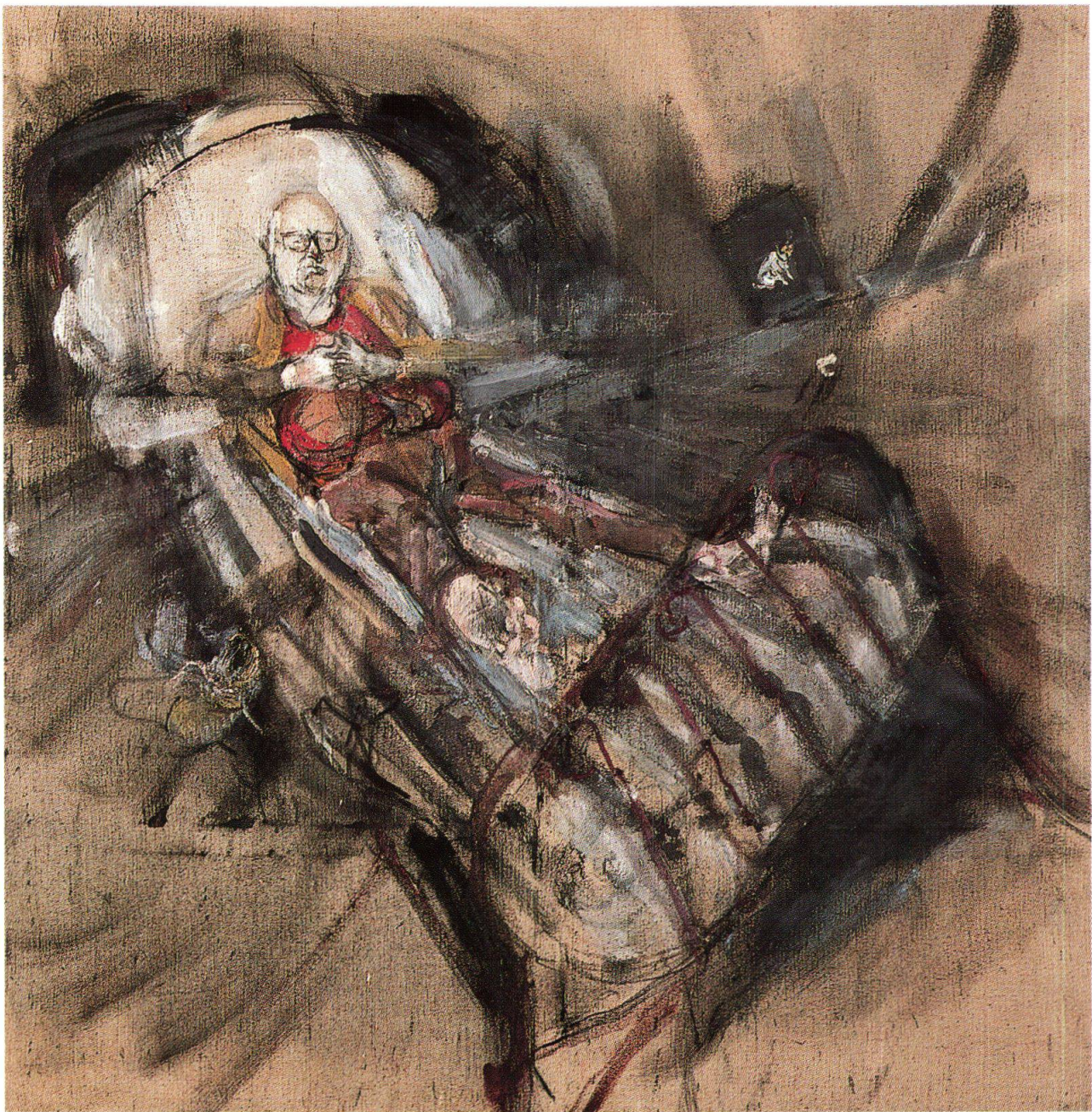
Varlin, Friedrich Dürrenmatt sul letto, 1974-75, olio e carboncino su tela, 181x180.5 cm, collezione della Città di Zurigo (cat. 1366)

Varlin non dimenticherà mai l'orazione funebre tenuta dal rabbino al funerale di sua madre: «[...] Il funerale non è stato, come la nostra cara mamma lo avrebbe meritato, il rabbino, che non era stato sufficientemente informato, ha tenuto un'orazione per me, piena di osservazioni presuntuose e fuori luogo [...]» 1 . Per questo motivo Varlin aveva sempre detto di non voler nessun rabbino alla sua tomba, visto che aveva già avuto la sua orazione funebre quando era in vita. Al posto del rabbino a dargli l'ultimo saluto sono due amici, Giovanni Testori e Friedrich Dürrenmatt.