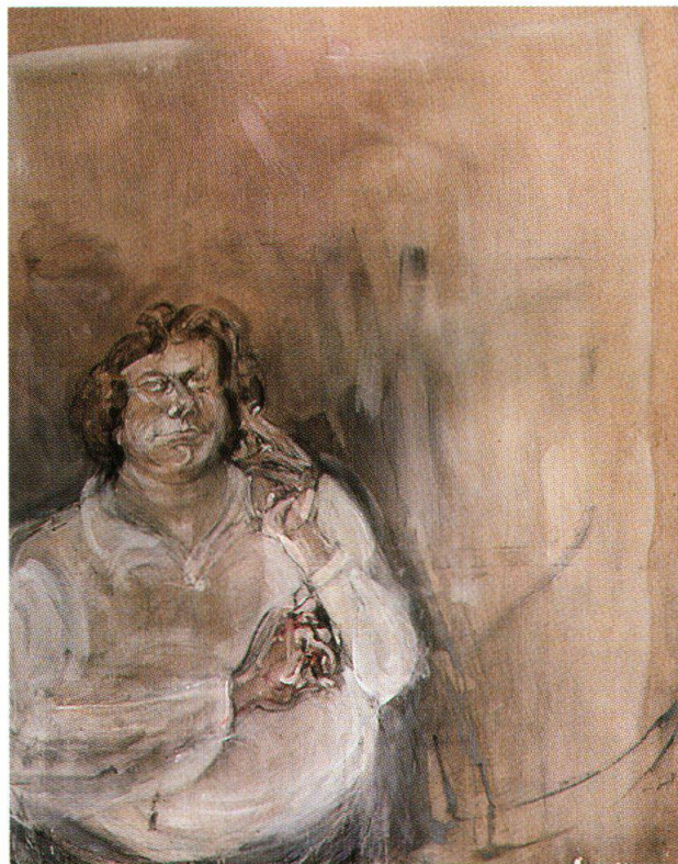
Varlin, Hugo Loetscher, ca. 1973, olio e carboncino su juta, 205x162.5 cm, collezione privata (cat. 1328)

La grande mostra allestita quest'anno al Kunstmuseum di Aarau in occasione del centenario della nascita di Varlin ha offerto al Dr. Hugo Loetscher l'occasione di ripassare in rassegna la vita e l'opera dell'artista. Proponiamo il discorso che Loetscher ha tenuto per l'apertura della mostra. Il testo è dettato da un rapporto di profonda amicizia e intimità tra lui e Varlin e mette l'accento su alcuni episodi comici e anche emblematici legati ai loro incontri di Bondo e Zurigo.