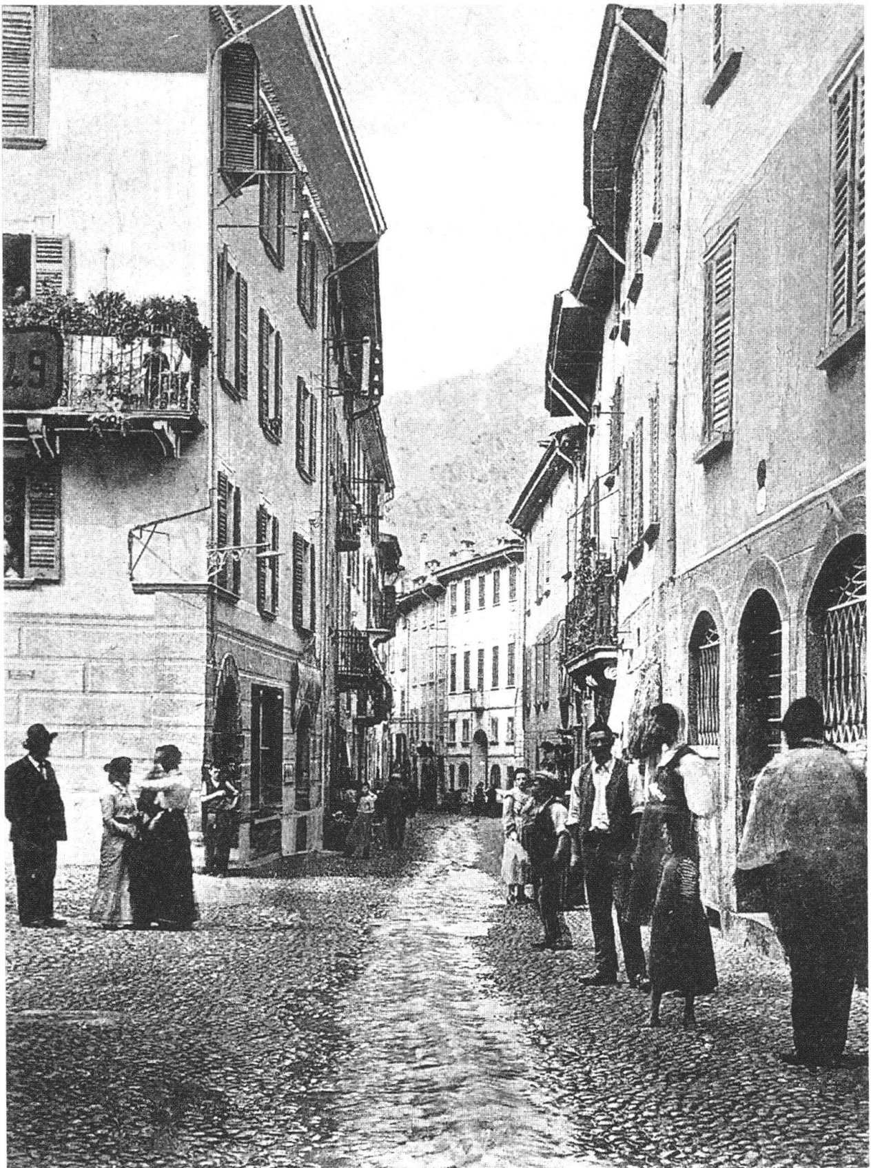
Chiavenna, Via Dolzino, 1899