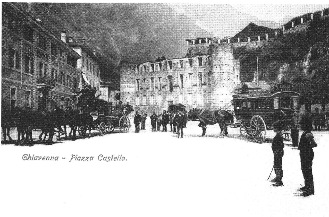
Chiavenna - Piazza Castello.

La visita a Chiavenna è un'affascinante incontro con la storia. Sulla Piazza Granda, attuale piazza Castello, si apre il Palazzo Salis. Quasi per 300 anni, dal 1512 al 1797, Chiavenna si ritrovò sotto la dominazione dei Grigioni. Un tempo, nella sala degli specchi del piccolo Palazzo barocco, si ritrovavano per le danze dame eleganti e uomini di cultura provenienti da lontano. Oggi le porte si aprono solo per rari concerti o mostre d'arte.