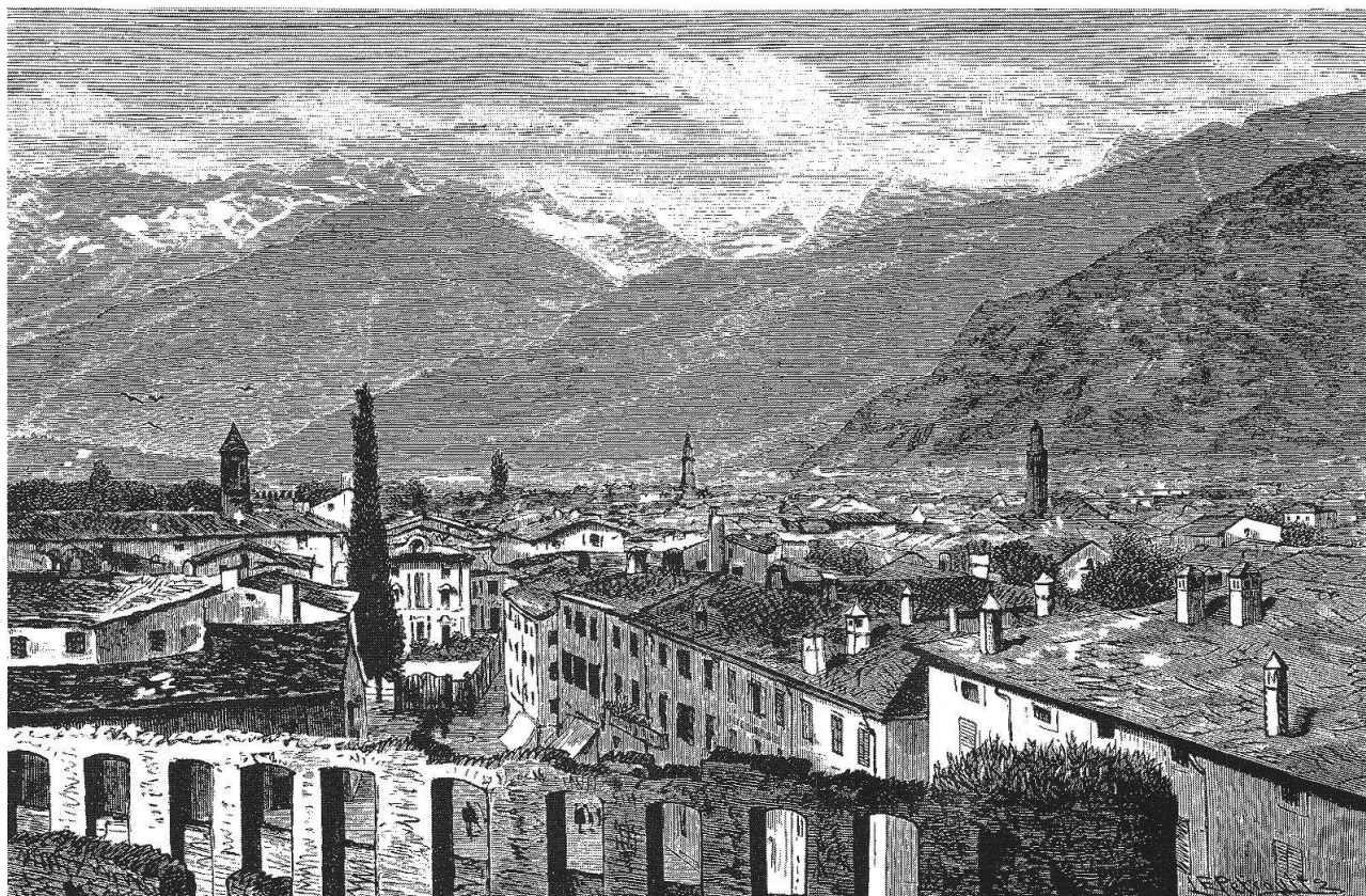
Chiavenna, silografia di Emil Petrovits, inizi del '900