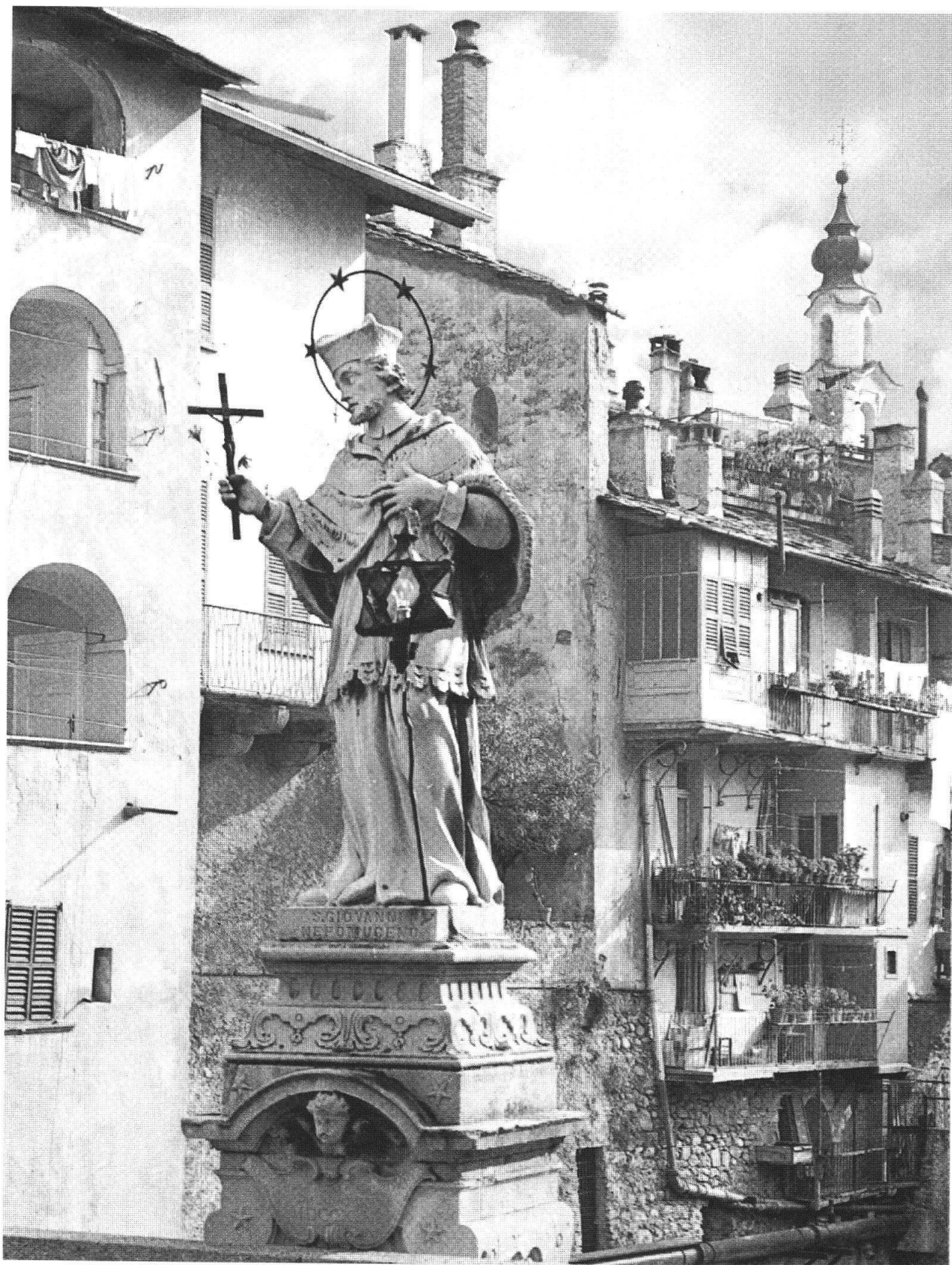
Ponte di Mezzo e di S. Giovanni Nepomuceno. È il ponte che da Chiavenna apriva la vecchia strada dello Spluga. Sullo sfondo loggiati delle case cinquecentesche costruite sulle mura sforzesche (XIV sec.)