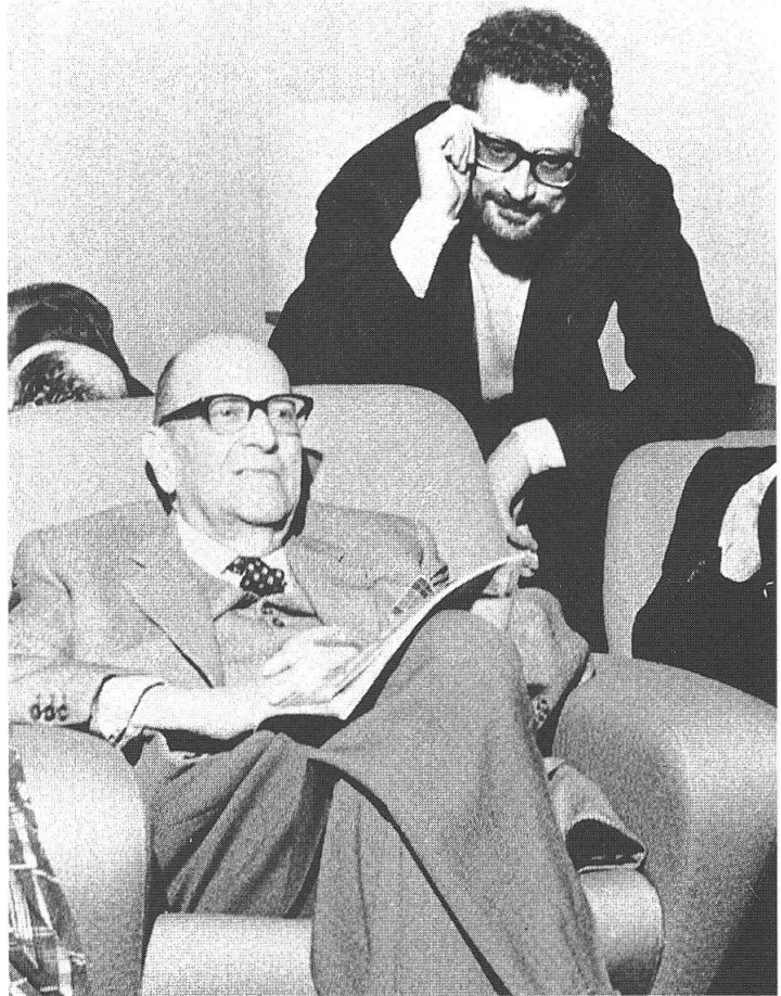
Grytzko Mascioni con Max Horkheimer

Penso che la Svizzera tedesca sia un po' viziata da prese di posizione o di clan o personalistiche o politiche. Ci si suddivide in piccoli cencacoli e questo, anche in ambito letterario, non giova alla comunicazione e allo scambio.