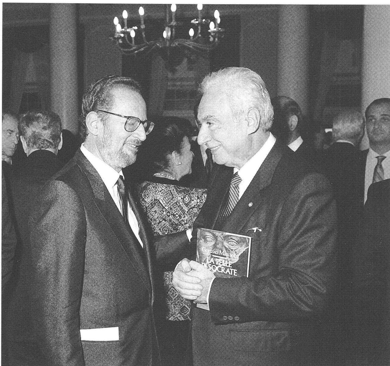
Grytzko Mascioni con Francesco Cossiga

Innanzitutto quello di resistere eroicamente alle mode, di non lasciarsi condizionare dal mercato letterario. Chi si mette a scrivere deve, o nella solitudine o nel confronto con gli altri, cercare se stesso, trovare qualcosa da dire, avere molta umiltà e volontà. Non bisogna lasciarsi sedurre da miti effimeri. Non credo per esempio che la volgarità porti da nessuna parte. Non è che una scappatoia facile per avere un'aria di contemporaneità che in realtà è solo una forma di fuga dai problemi reali.