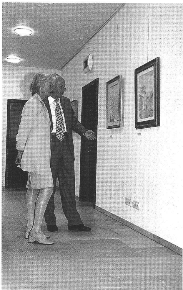
L'artista con la vicepresidente della Sezione di Coira della PGI