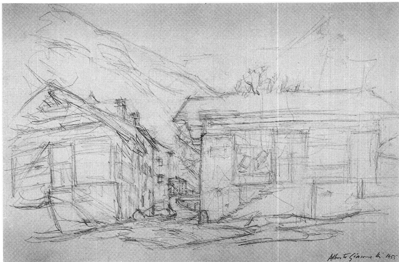
Stampa, 1955, collezione privata

sentita come nefasta, dato che lo cacciava dal suo «Paradiso» per sua colpa, gli si manifestò. E queste pagine svelano pure ch'egli aveva compreso, tramite un'alta pietra nera scorta nel bosco un giorno in cui s'era allontanato dal perimetro dei giochi, che avrebbe dovuto vivere come quella pietra si ergeva là, sola, nuda. Giacometti aveva troppo amato vari aspetti della sua pristina condizione per desiderarne del tutto un'altra e sostituirla; si sarebbe dunque trovato ad assumere la propria lucidità, la propria critica, la propria libertà, come cause di miseria, ma accedendo in cambio – ed ecco il primo punto da tener presente – ad un'esperienza tutto sommato diretta dell'essere, che normalmente si dissimula sotto le diverse maniere in cui l'esistenza è vissuta.