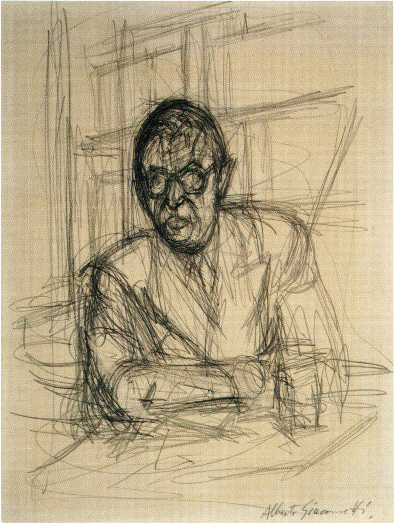
Jean-Paul Sartre, 1946