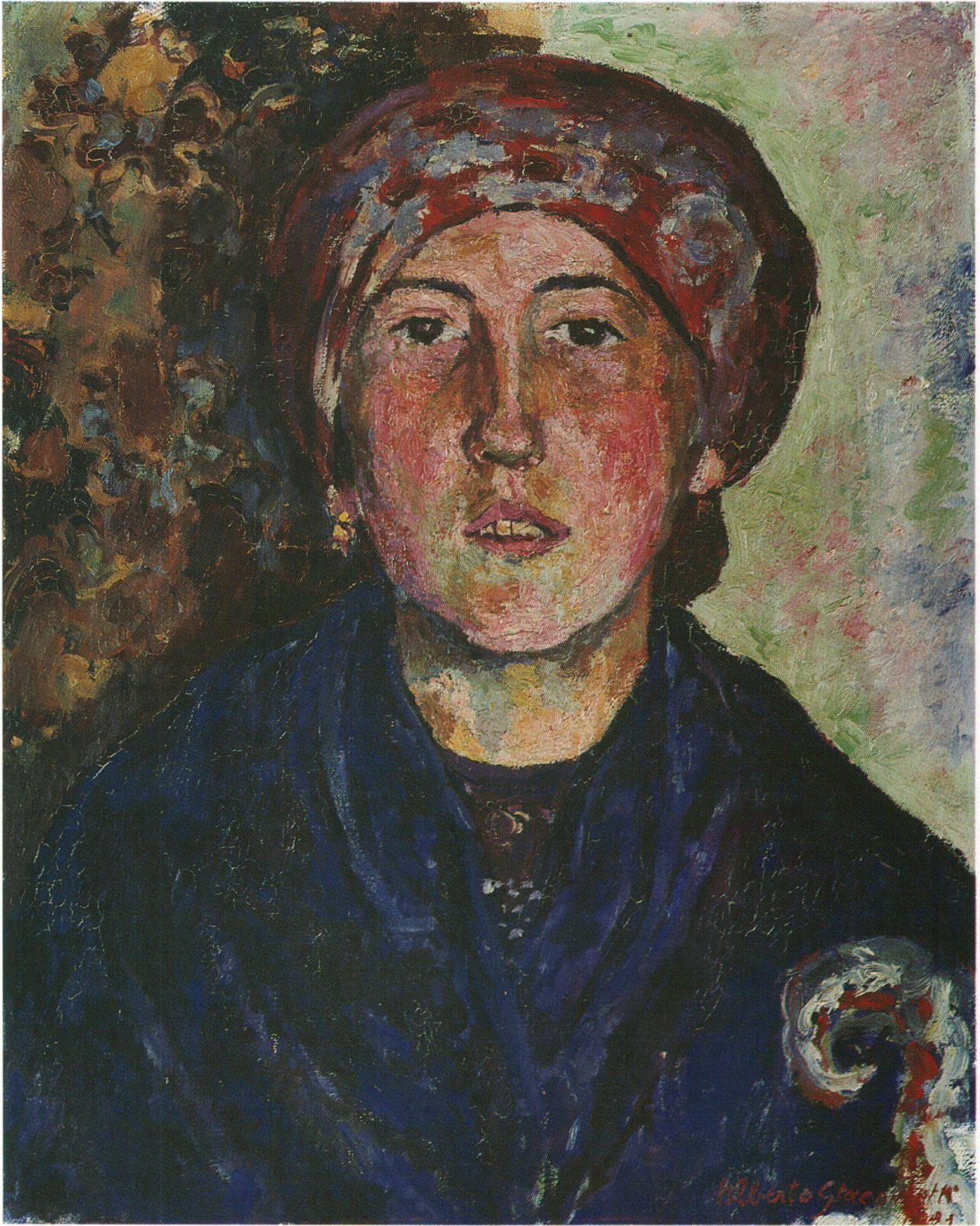
La Bregagliotta, 1921, Museo d'arte Grigione, Coira