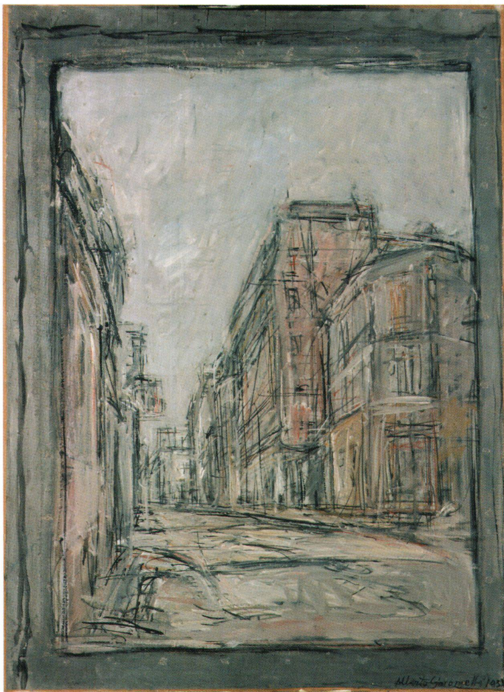
La Rue, 1952, Fondation Beyeler, Riehen/Basel