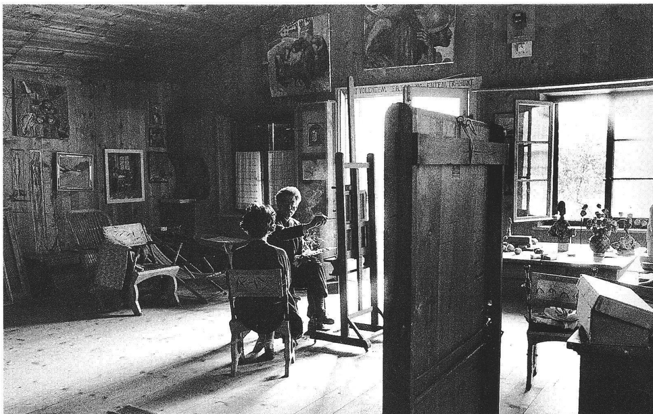
Alberto Giacometti con la moglie Annette nell'atelier di Stampa, 1960