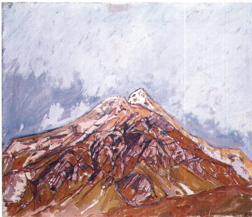
Paesaggio presso Maloja. Piz de la Margna, 1924, Musée Jenisch, Vevey

Il portoncino si richiude. Stampa è ancor più deserta, in quest'ora che segna il desinare delle genti montane. Neanche transitano automobili, adesso. Mi appoggio al parapetto sul Maira e guardo in alto. Il mezzogiorno culmina senza mostrarsi: nemmeno a mezzogiorno il sole riesce a far capolino; sembra protendersi verso l'alto per sbocciare, sembra farcela, ma una forza risucchiarlo da terra – resta come un'aureola dietro la più alta rupe, mentre l'invincibile ombra avvolge le case.