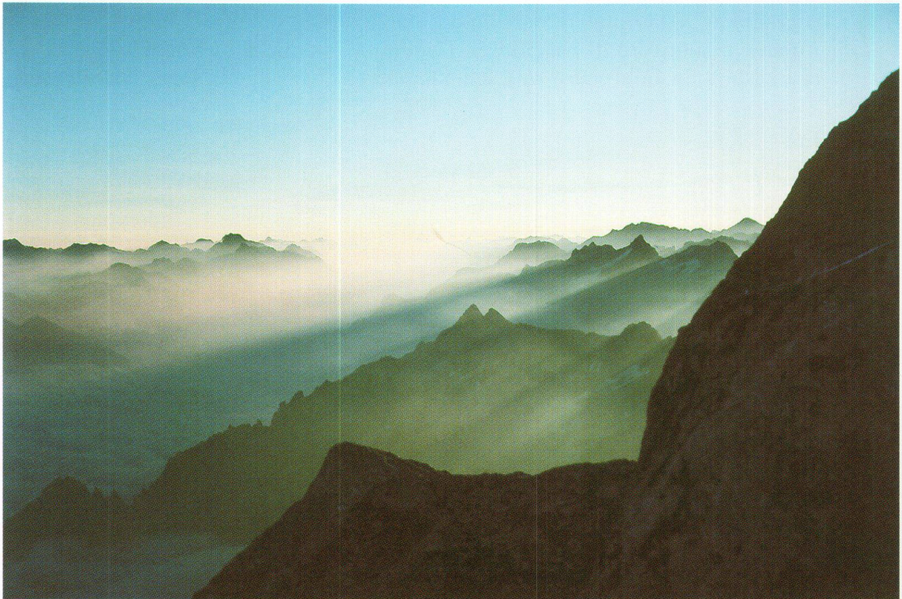
Sera sulla cima del Badile

Con le dita irrigidite per il freddo e le membra legnose iniziamo la salita della parete delle pareti. Grazie alla tecnica di arrampicata e all'equipaggiamento moderni, come