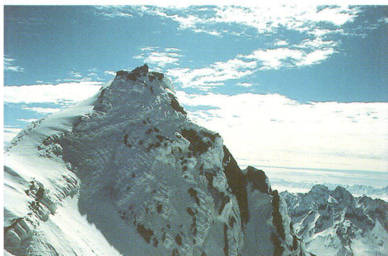
Cima della Bondasca, Bregaglia