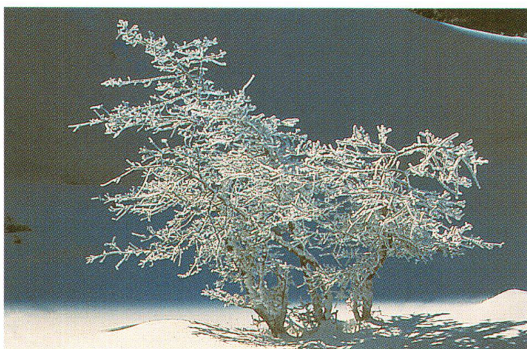
Due impressioni invernali