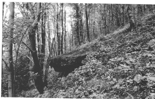
Fig. 6. Rispresa attuale del sasso su cui poggiava il castagno no. 1 della foto d'epoca.