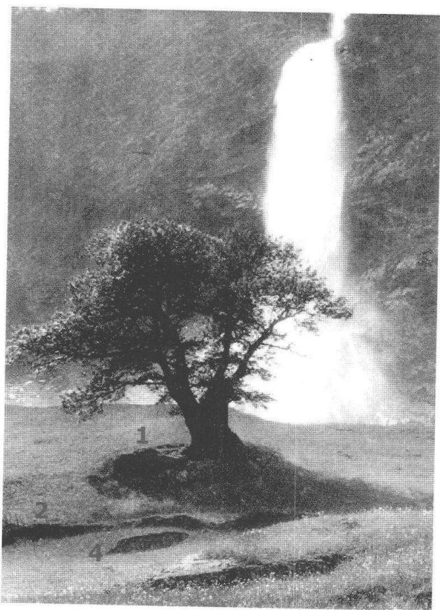
Fig. 4. Dettaglio della Cascata Buffalora in una foto d'epoca.