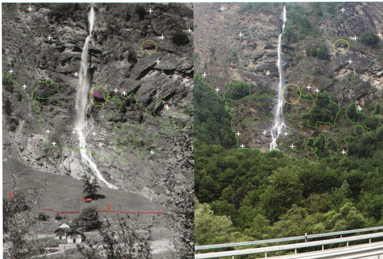
Fig. 3. Cascata Buffalora. Foto d'epoca (a sinistra) e ripresa attuale (a destra).

Spostiamoci ora di fronte ad uno dei quadri paesaggistici più rappresentativi del Moesano: la cascata della Buffalora, così come appariva su una cartolina 25 spedita da Mesocco il 12 settembre 1927: esposta e vittoriosa su tutto lo spazio circostante, slanciata fra pareti rocciose, estesi prati, un piccolo nucleo di edifici rurali e qualche castagno da frutto