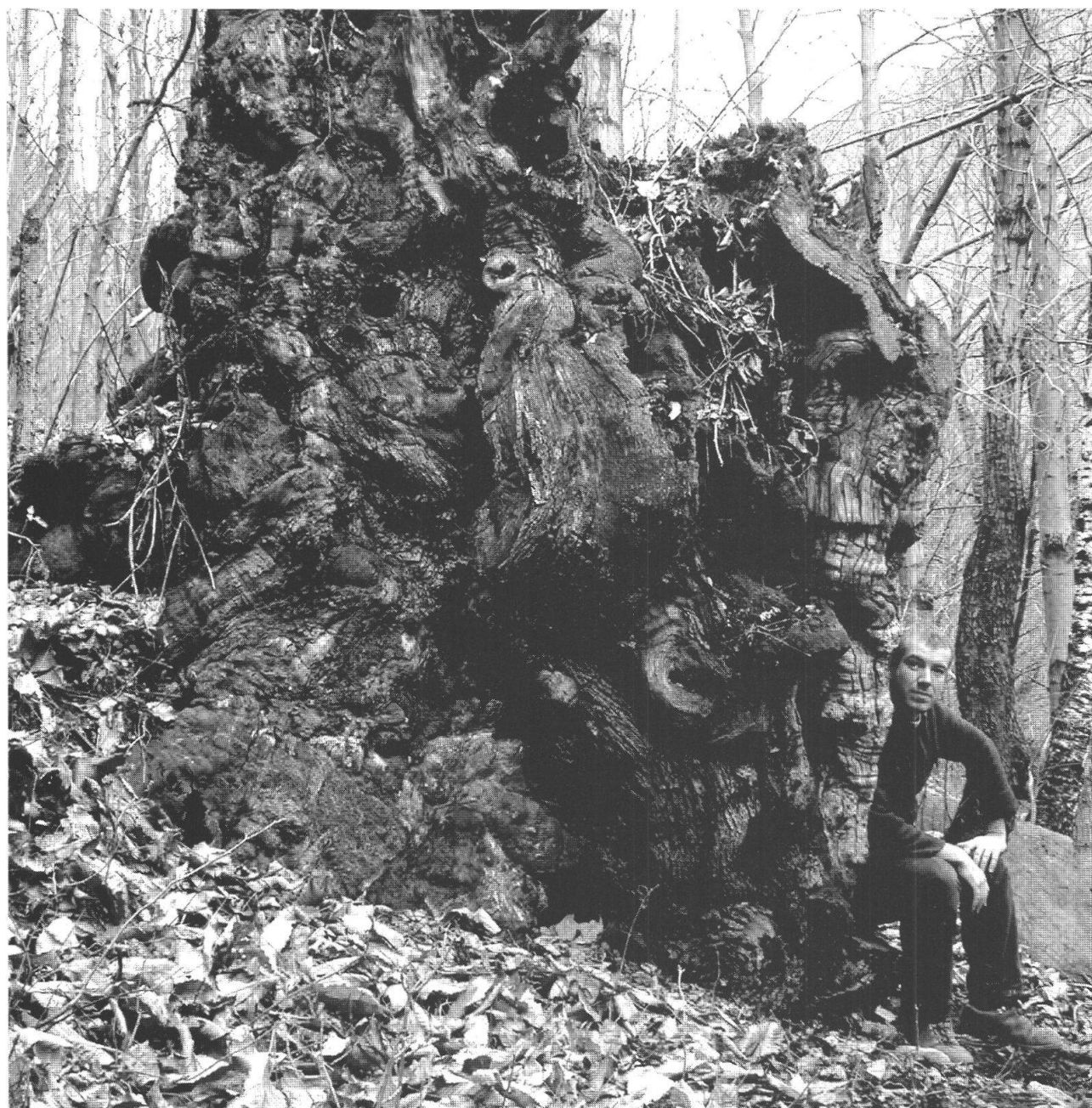
Fig. 7. Stato attuale del castagno no. 2.

distruzioni e perdite. Cosicché il declino della castanicoltura è coinciso con pesanti stravolgimenti paesaggistici e notevoli crisi e rivoluzioni culturali.