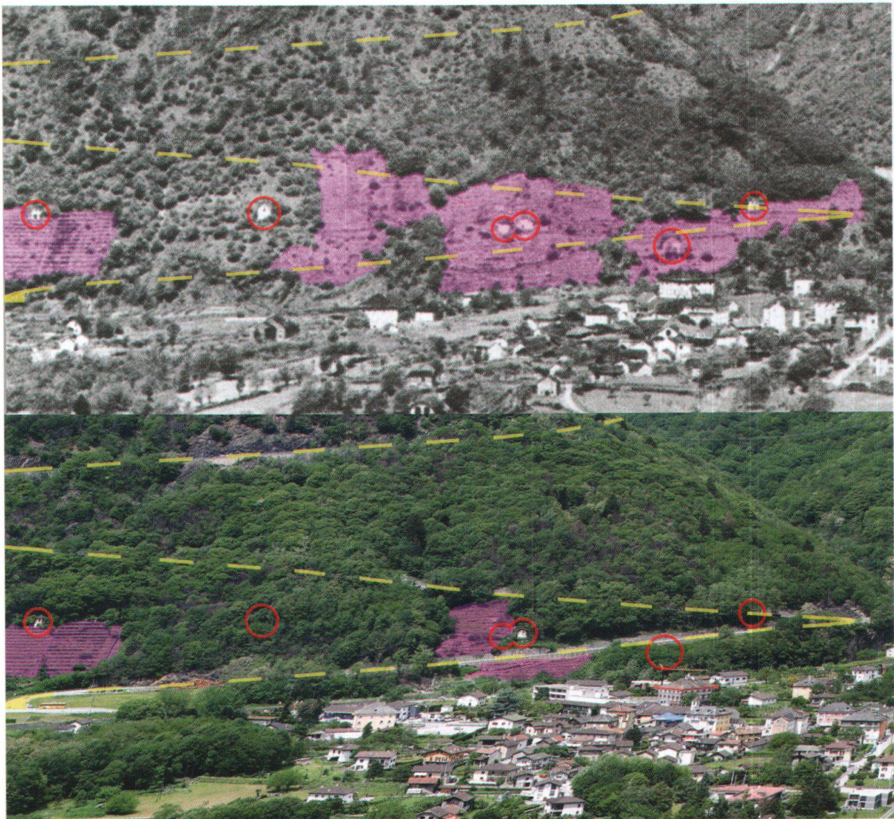
Fig. 1. - Grono, partenza della nuova strada per la Calanca. Foto d'epoca (in alto) e ripresa attuale (in basso).