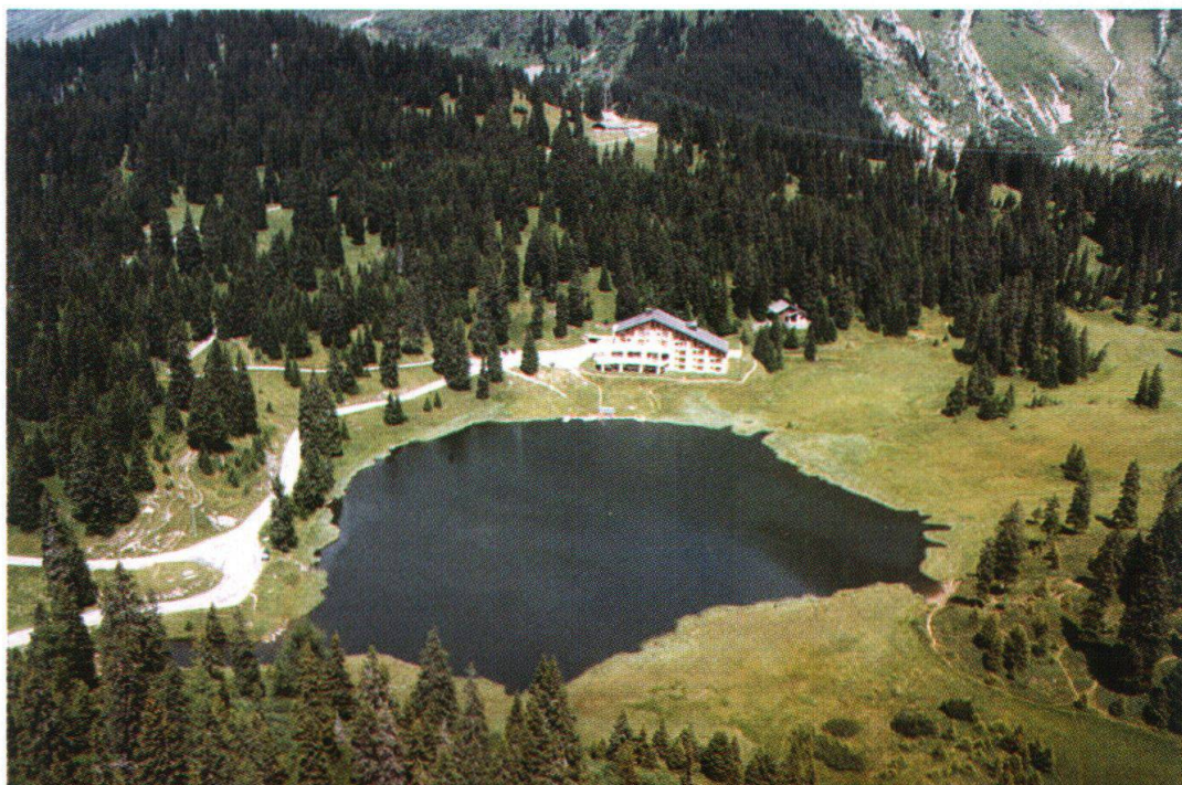
Figura 1: Veduta panoramica del Lago Doss e parte de suo bacino imbrifero.