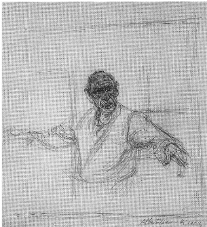
Ritratto di Igor Stravinsky, 1957, proprietà privata

Fissava assorto per ore un volto, un albero, un bicchiere, un raggio di sole: e cercava di riprodurre lo stupore di quello sguardo. Era straordinaria la concentrazione di Alberto Giacometti sul lavoro. Una sua testimonianza: «Quando per la prima volta vidi chiaramente che la testa si pietrificava, si immobilizzava, in un istante mi accorsi che non era più una testa viva ma un oggetto, che guardavo come un qualsiasi altro oggetto. Oppure no!