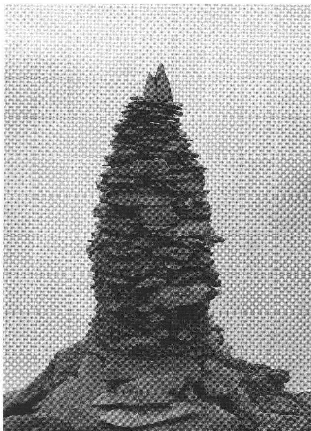
Camino Curnasel, Valposchiavo Giugno 2006