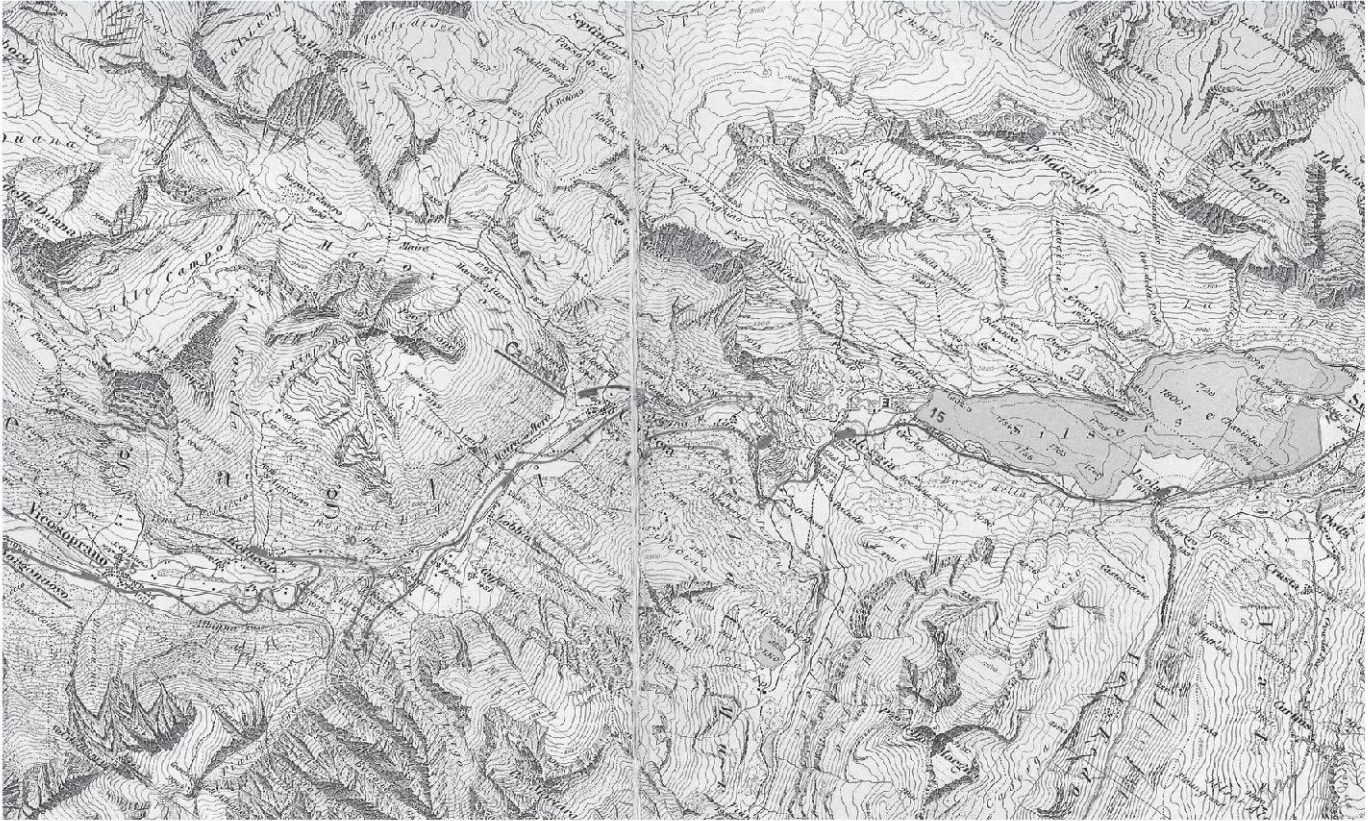
Un estratto del progetto di Philipp Holzmann, Francoforte, 1897. Il progetto fu osteggiato dalla Ferrovia retica, che non voleva rinunciare alla concessione per la ferrovia in Bregaglia (Ciäsa Granda).