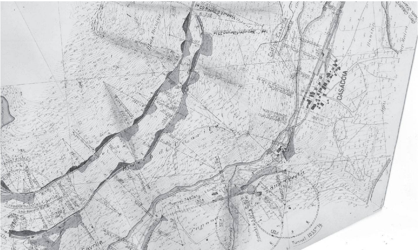
Il tracciato della Bergellerbahn presso Casaccia nei piani della Ferrovia retica del 1918 (Ciäsa Granda).