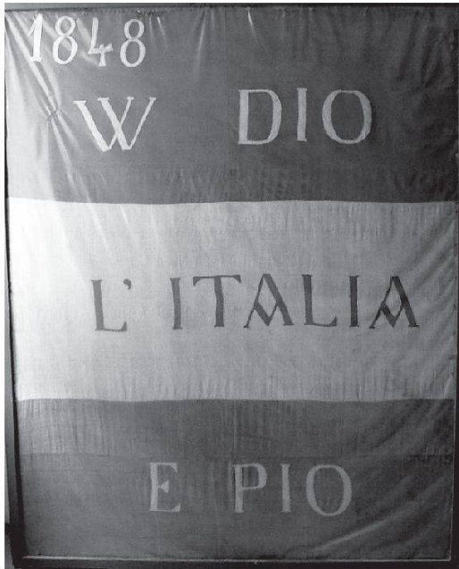
Bandiera nazionale tricolore (con le bande orizzontali, dal momento che non era ancora stata codificata in maniera definitiva), utilizzata nella «rivoluzione» di Chiavenna del 1848, conservata presso la Società Democratica Operaja di Mutuo Soccorso di Chiavenna.

Nel frattempo, nel clima della «Primavera dei popoli» e delle insurrezioni in tutta l'Europa continentale (che mettono in crisi gli imperi multinazionali, come l'asburgico), scoppia la Prima Guerra d'Indipendenza contro l'Austria, con la partecipazione di molti stati italiani: in primis il regno di Sardegna, ma anche il granducato di Toscana, lo Stato della Chiesa e il Regno delle Due Sicilie.