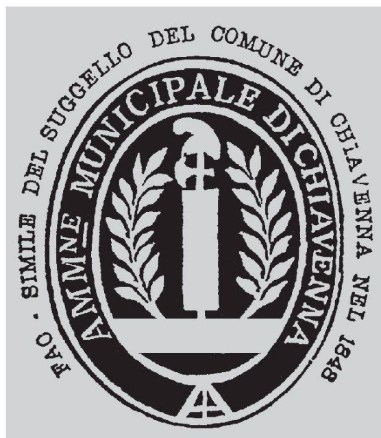
Sigillo rivoluzionario comunale, Chiavenna, 1848.

Molto interessanti sono peraltro alcuni fatti che caratterizzano la «rivoluzione» di Chiavenna nel 1848, specie nella sua seconda fase, meno spontanea di quella della primavera, e invece spiccatamente «repubblicana» nella sua impostazione mazziniana. In particolare, vengono adottati