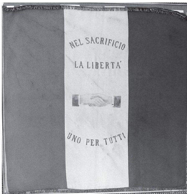
Vessillo della Società Democratica Operaia di Mutuo Soccorso di Chiavenna, probabilmente risalente ai primi del XIX secolo, conservato presso la sede del medesimo sodalizio, in Chiavenna.

democratica) in parlamento e fuori, ma anche mediante azioni militari (come le spedizioni garibaldine dell'Aspromonte del 1862 e di Mentana nel 1867), cospirazioni (come il tentativo di insurrezione militare di Pavia del 1870, costata la fucilazione al caporale Barsanti) 22 e attentati antimonarchici (come quelli contro re Umberto I nel 1878 e 1897, fino a quello, fatale, nel 1900).