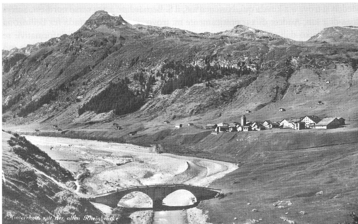
Hinterrhein all'inizio del Novecento, con l'alte Landbrugg in primo piano

Forse, da qualche parte nell'aria, c'è ancora l'animazione che caratterizzava questo villaggio – strategico e vivace luogo di passaggio in direzione del valico dello Spluga (e dunque di Chiavenna) e del S. Bernardino: anche a Splügen ci sono grandi residenze a più piani, che testimoniano l'agiatezza dei contadini-somieri addetti al trasporto delle merci lungo il tratto di loro competenza, da una sosta all'altra. Queste squadre si componevano di valligiani reclutati in loco, i quali dovevano anche assicurare la viabilità delle strade di transito; ogni anno un «giudice dei Porten», riunito in assemblea, ne valutava severamente l'operato. Ancora verso il 1850 il totale delle merci trasportate si aggirava attorno alle 14000 tonnellate annue, mentre le bestie da soma erano più di trecento! Le cantine e le rimesse nascondono, in condizioni non del tutto ottimali, carrozze, carri, basti, corde, bubboliere, botti e portantine.