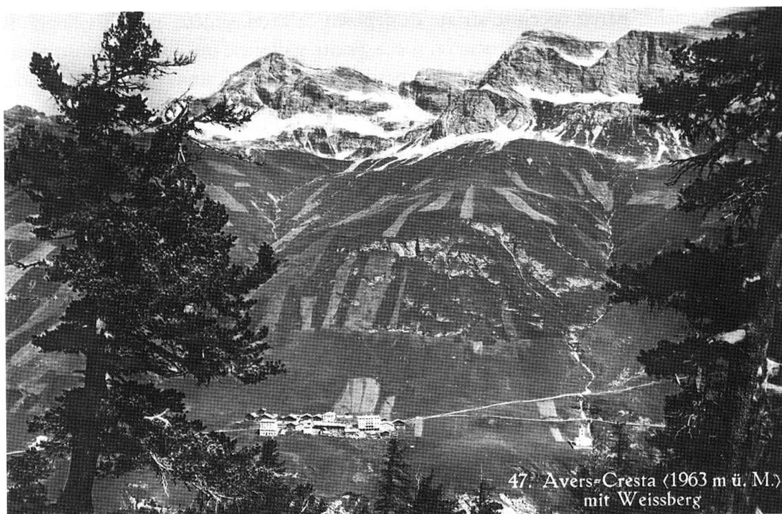
47. Avers-Cresta (1963 m ü. M.) mit Weissberg

Cresta, Valle di Avers: in primo piano, i larici secolari della Capettawald; sul versante orografico destro si vedono distintamente i prati da sfalcio in quota