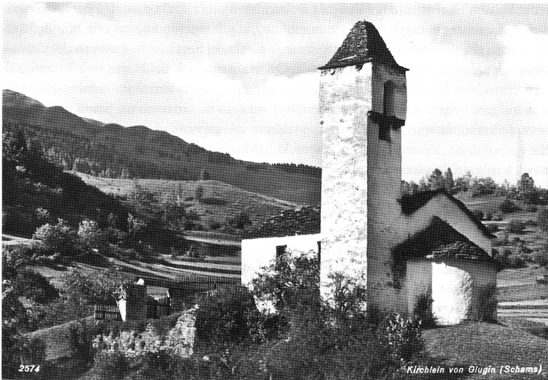
La piccola chiesa di Clugin e, sullo sfondo, lo Schamserberg nel 1939

da cui spunta un bel cuscinetto di stelle alpine; quella del 1963 dev'essere stata vinta a Zillis e ritrae un cacciatore nel bosco che, appostato dietro un albero, osserva un bell'esemplare di cervo. «Di chi sono queste medaglie?».