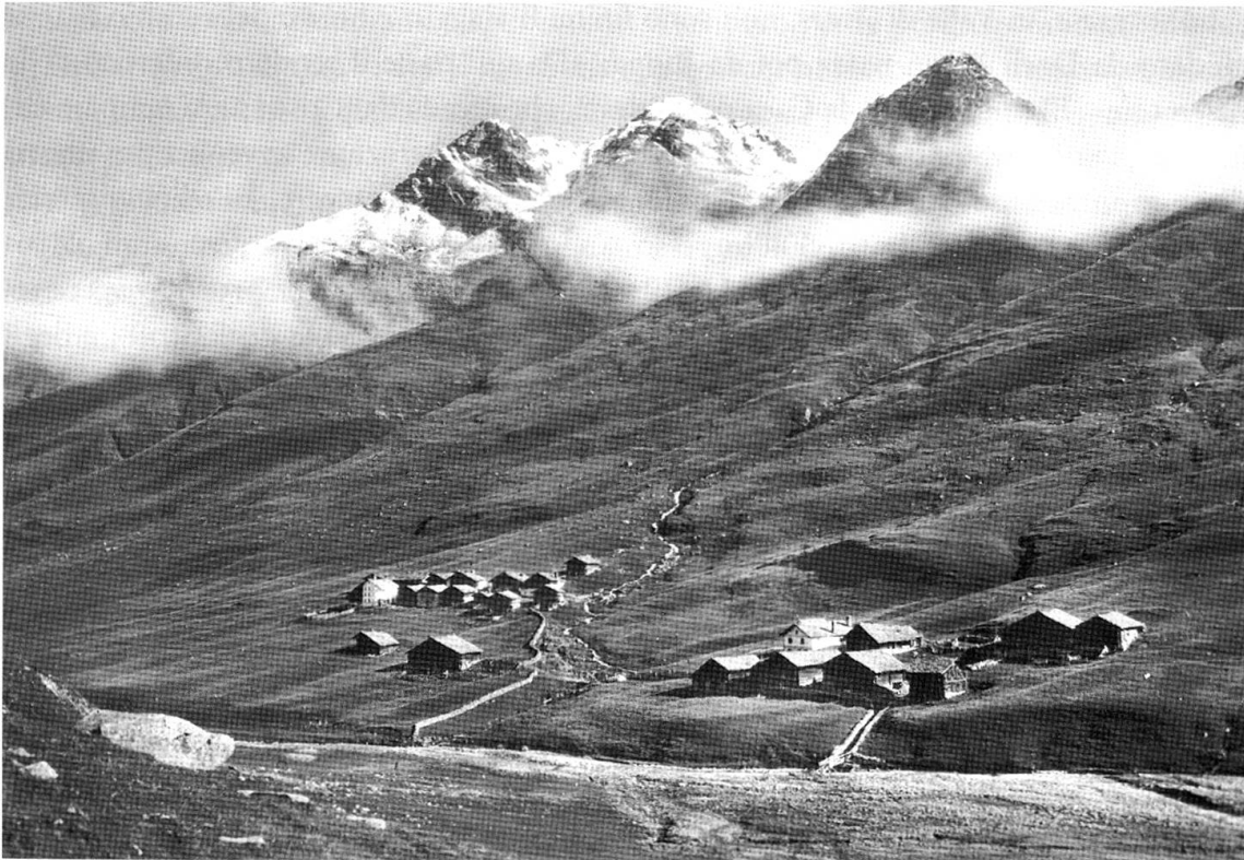
Juf all'inizio del Novecento: spicca la demarcazione tra Ober Juf e Under Juf

raggiamento; d'un tratto qualcuno, dal bordo della strada, ci saluta con entusiasmo, anzi gesticola come se volesse accoglierci o darci spiegazioni riguardo al percorso da intraprendere.