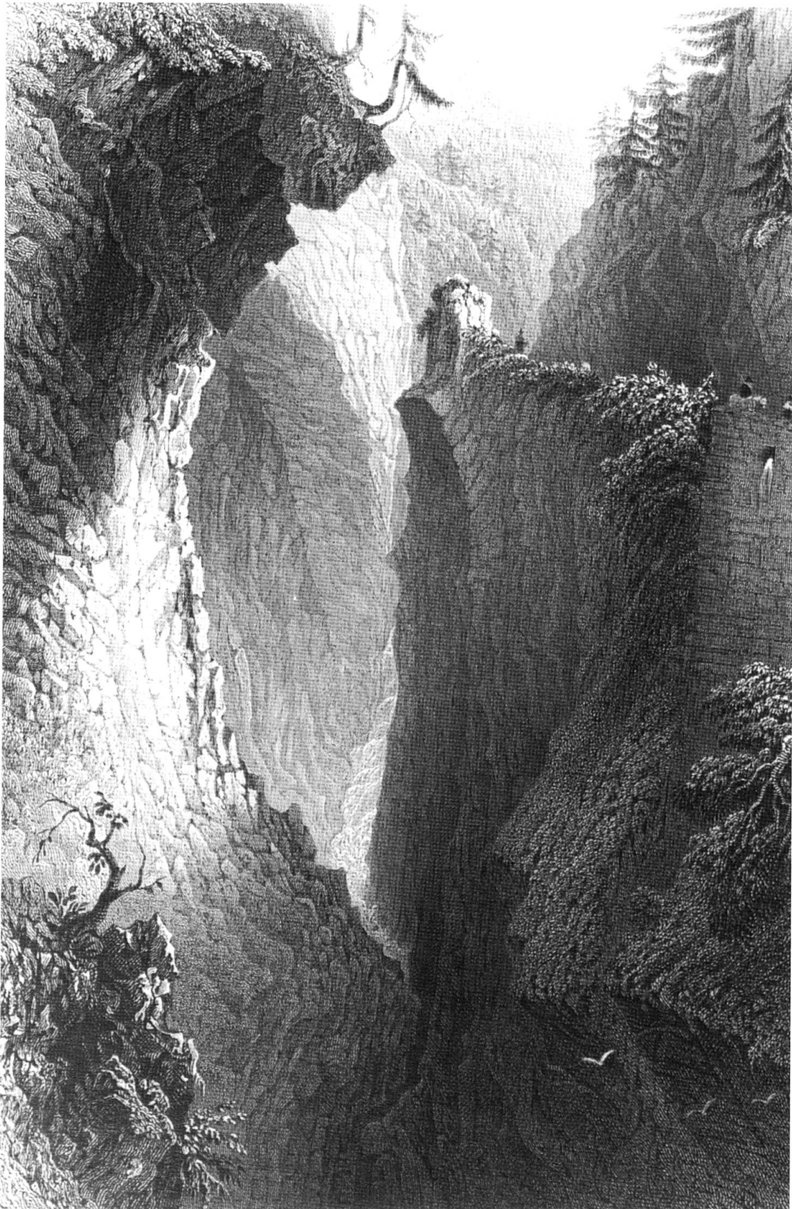
The gorge of the Rhine, Via Mala (Grisons): incisione di William Woolnoth su disegno di William Henry Bartlett, 1834. 18 x 12 cm