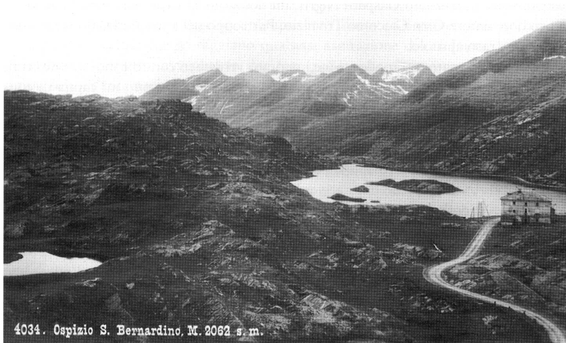
4034. Ospizio S. Bernardino, M. 2062 s. m. Il Passo del San Bernardino e l'Ospizio, costruito nel 1824-1825, attorno al 1920