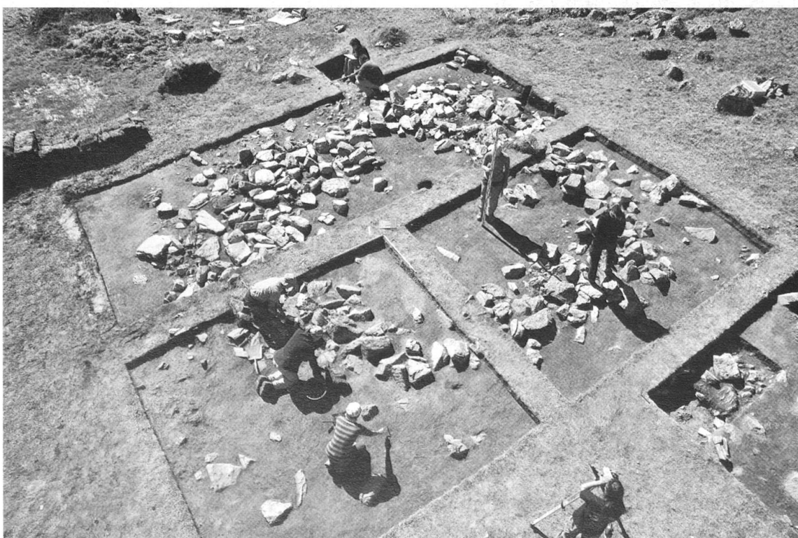
Scavo della fondamenta della capanna alpestre dell'Epoca di Hallstatt, datata attorno al 600 a.C.

La ceramica è molto importante e notevole, non solo per la crono-tipologia, ma anche per la funzione della capanna – è da presumere che già allora il latte veniva lavorato per produrre formaggio. Ma è veramente una capanna alpestre – o forse una capanna preistorica del Club Alpino Svizzero? I risultati dell'archeobotanica mostrano l'influsso antropico e animale sul territorio nel primo millennio a.C. Ritrovamenti