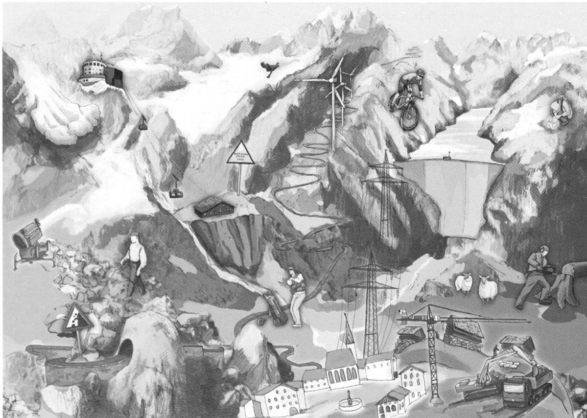
Archeologia alpina: siti sensibili, scenari di minaccia multipli e nuove sfide.

I siti archeologici alpini, che attraversano 11 millenni, gettano una nuova luce sulla regione del Silvretta, finora poco studiata. Le scoperte attuali e le metodologie appli-