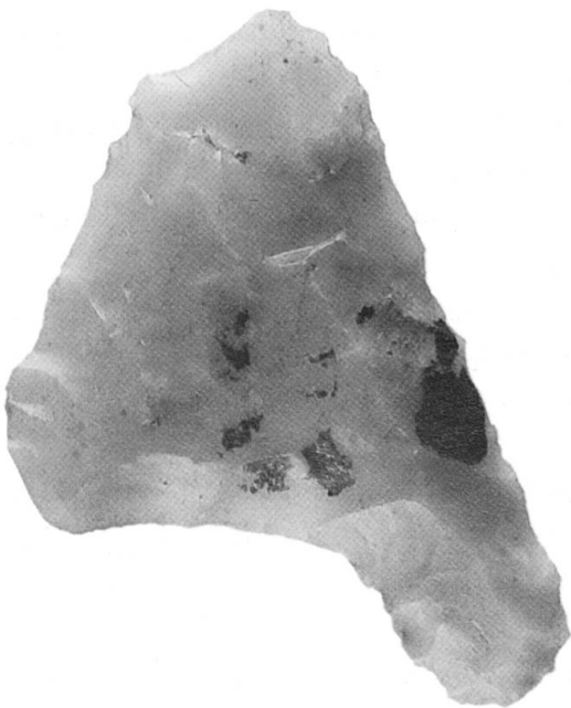
Val Urschaj, Plan da Mattun, sito L1: punta di freccia in selce con residui di catrame di betulla usato quale colla, VI o millennio a. C.

nell'Alta Engadina, mostrano però chiaramente che tutte le valli e i passi alpini della nostra regione erano percorsi in modo intensivo da gruppi di cacciatori preistorici. Attualmente le carte di distribuzione di questi uomini non rispecchiano la realtà del passato, bensì l'attuale stato della ricerca, ancora molto lacunoso. Le analisi di selce e cristallo di rocca, di cui sono fatte le armi e gli attrezzi ritrovati, dimostrano che già in quel periodo esistevano reti di contatto e di commercio transalpini ben sviluppati.