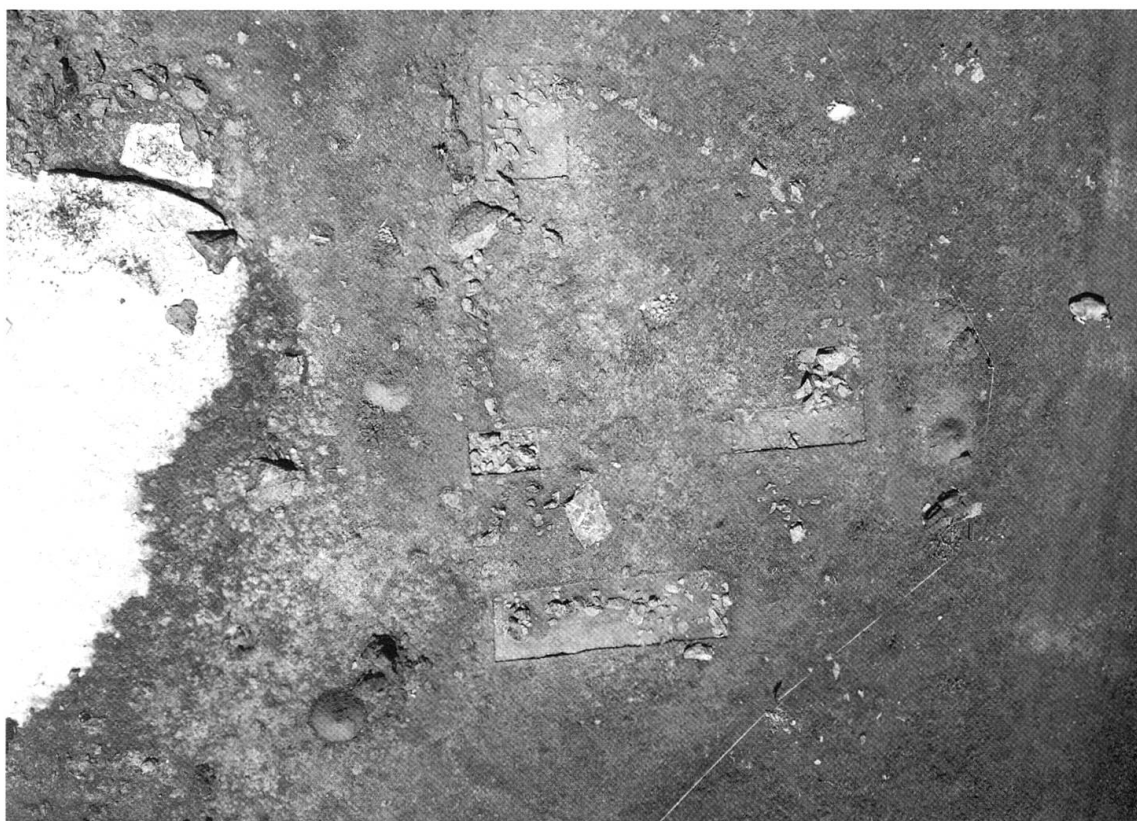
Val Tasna, Plan d'Agl, ripresa aerea tramite droni del recinto dell'Età del Ferro durante lo scavo nell'estate 2008

Così poco appariscente come la capanna alpestre dell'Epoca di Hallstatt nella Val Fimber, si presenta anche un recinto in sassi in Val Tasna sopra Ardez e Ftan, scoperto nel 2007, anch'esso dell'Età del Ferro e poco più recente. Anche qui, lo scavo archeologico ha potuto chiarire la struttura della costruzione e documentare le zone di attività dei pastori preistorici sotto forma di focolari e concentrazioni di ceramica e di selce. La datazione di questa recinzione attorno al 400 a. C., a livello svizzero del tutto singolare, è stata nuovamente possibile grazie alla datazione al radiocarbonio rispettivamente alla classificazione della ceramica. È presumibile che circa 2500 anni