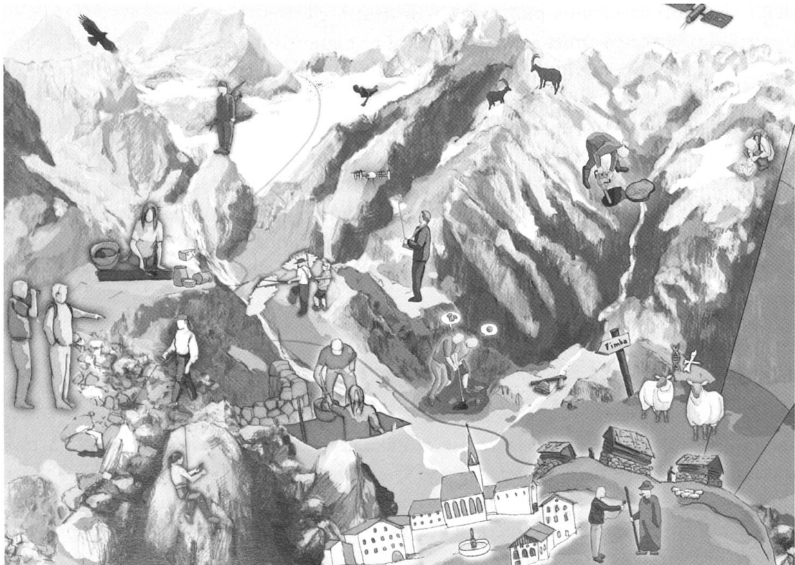
Archeologia alpina – Domande e metodi adottati nel progetto Silvretta

Naturalmente, oggi un progetto archeologico non fa solo archeologia. Il progetto Silvretta combina perciò numerose scienze e applicazioni tecniche con domande storiche culturali e risultati degli scavi. Per esempio, l’archeozoologia - l’analisi di reperti animali - può dare risposte importanti sulla nutrizione, sull’economia venatoria e pastorizia, sulle strategie di domesticazione, di allevamento e sulle attività stagionali come l’alpeggio. Solo grazie a questa collaborazione è possibile ricostruire un quadro verosimile del passato, le cui testimonianze ci sono pervenute in modo così frammentario. La grafica mostra le differenti domande e i metodi adottati nel progetto Silvretta.