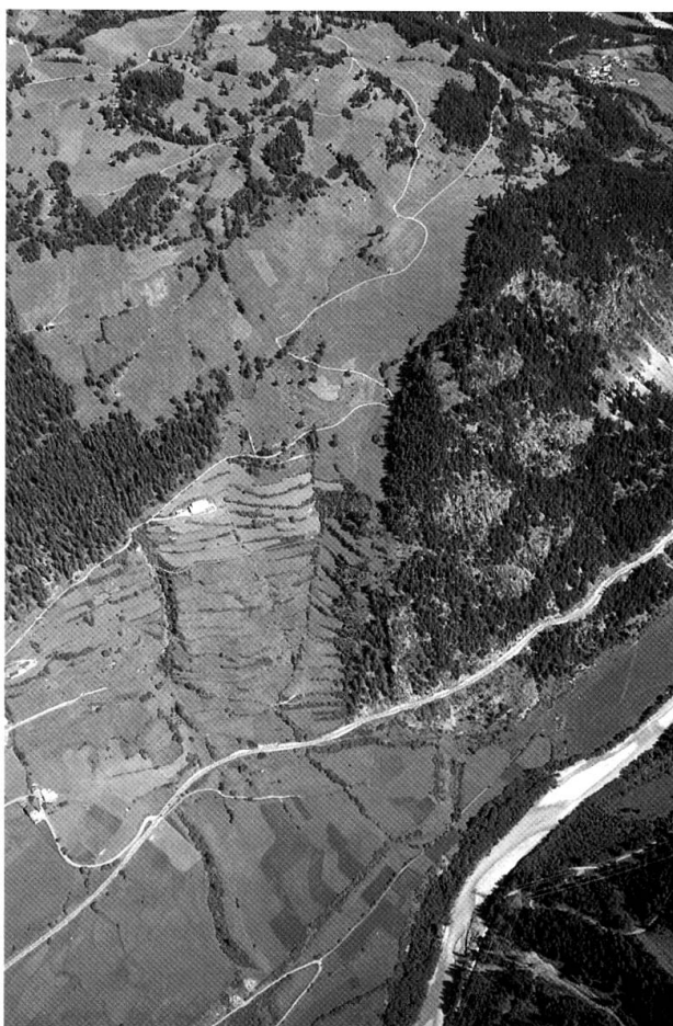
Il sito Ramosch-Mottata e le terrazze coltivate nelle vicinanze

L'obiettivo di questo studio è stato formulato da Lotti Stauffer Isenring già nel 1983: «Probabilmente una ricerca sistematica di insediamenti alpestri temporanei porterebbe a una maggior conoscenza di questo ramo dell'economia». L'illustrazione mostra il sito di Ramosch-Mottata e le terrazze coltivate nelle vicinanze. Questo sito dell'Età del Bronzo era un punto di controllo preistorico presso un'im-