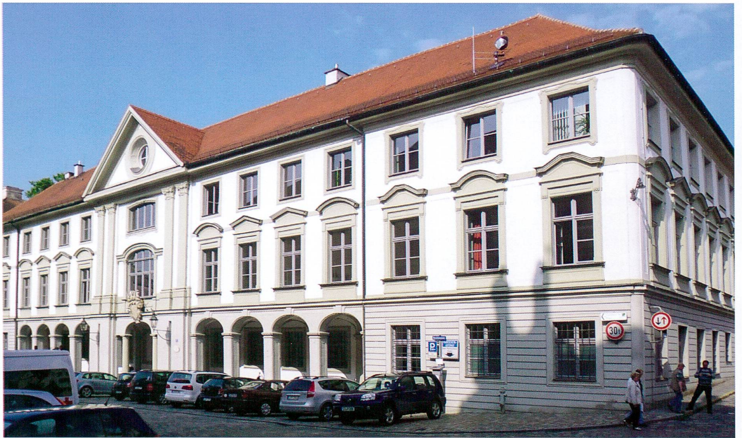
Eichstätt. Cancellaria della Corte. 1726-28