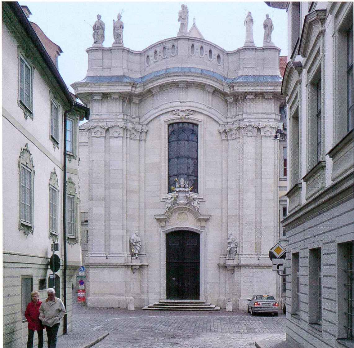
Eichstätt, Facciata del Duomo. 1714