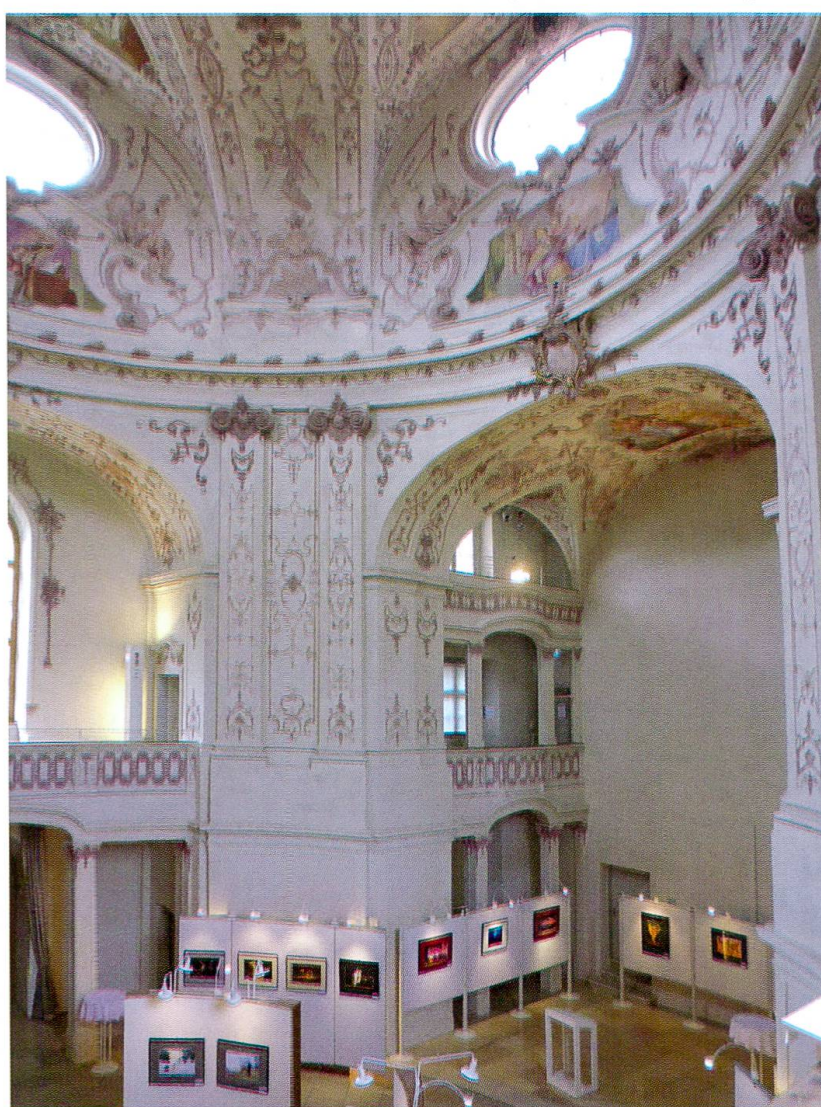
Eichstätt, Chiesa Notre-Dame: interno. 1718-21