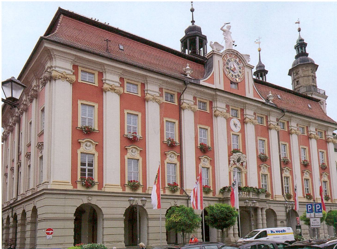
Bad Windsheim. Municipio 1713