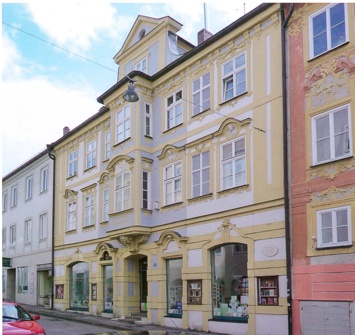
Eichstätt. Casa di Gabrieli. 1733