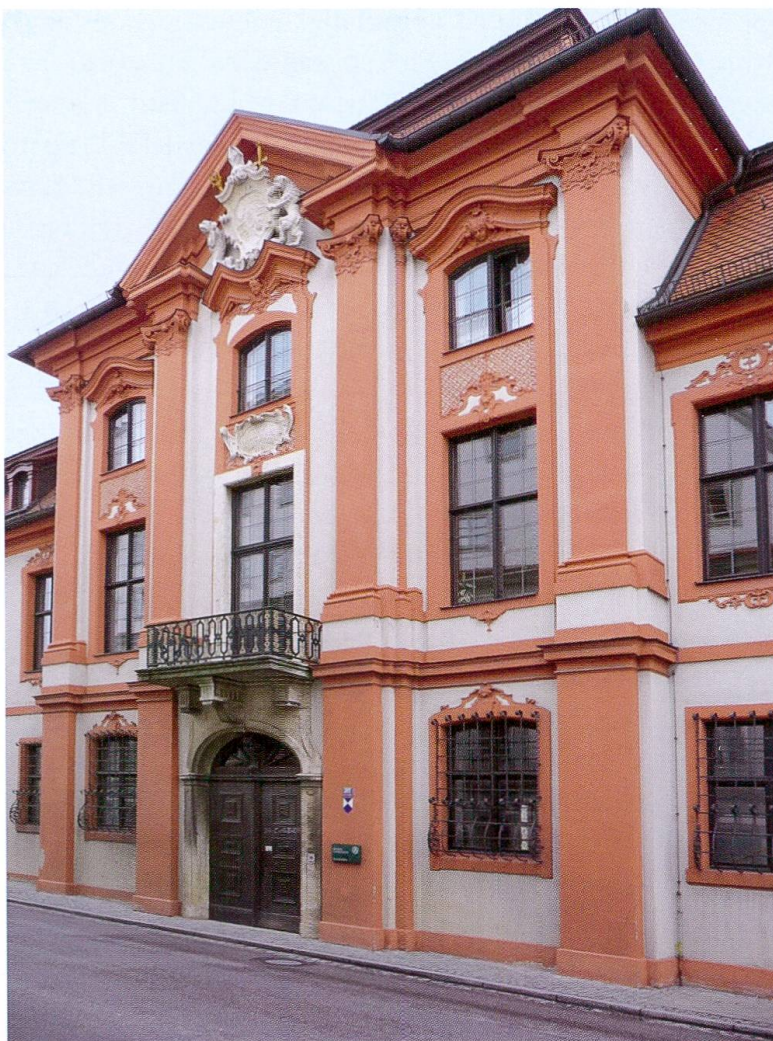
Eichstätt. Residenza estiva. 1732-35