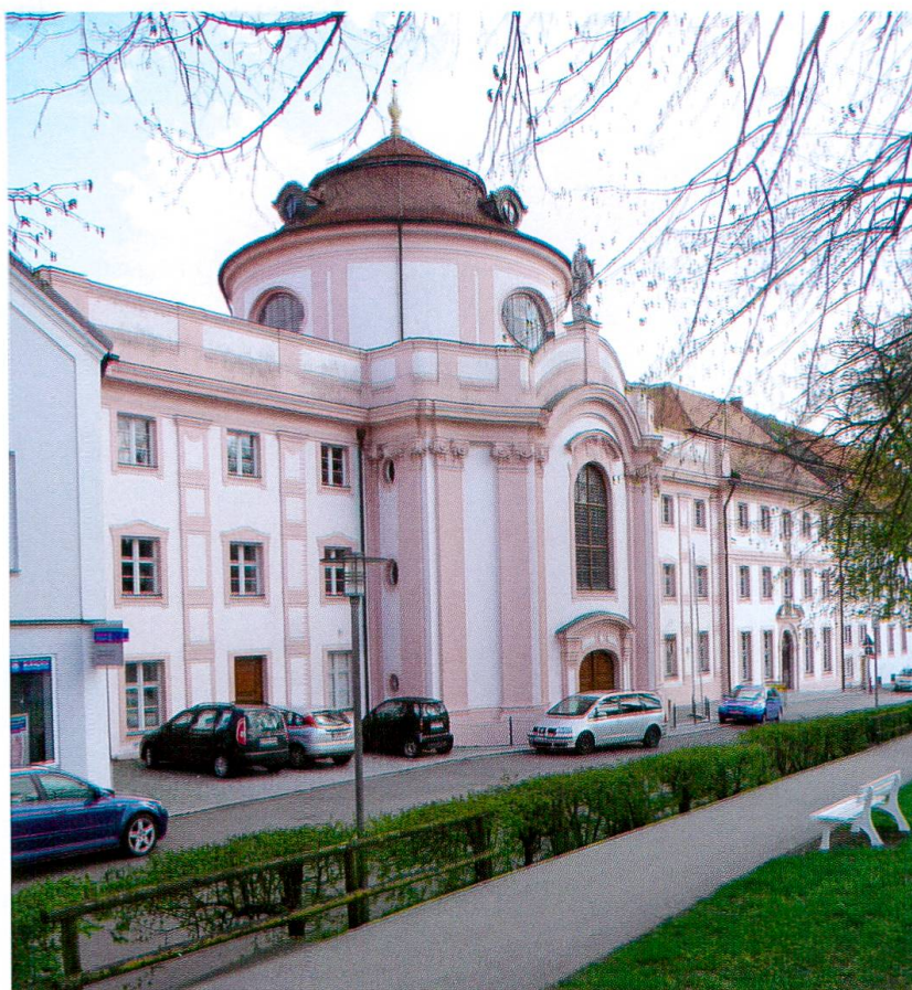
Eichstätt, Chiesa Notre-Dame: esterno

L'epoca del fervore edilizio dominato dalle squadre mesolcinesi stava tramontando,