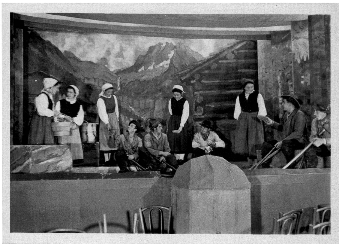
Le ragazze di Nasciarina accolgono con gioia i giovani che sono appena tornati da una giornata di caccia, foto dalla rappresentazione del 1952

Il messaggio più importante che secondo me Giovanni Andrea Maurizio ci ha voluto lasciare, e che per tanto tempo non è stato compreso fino in fondo, è che non importa