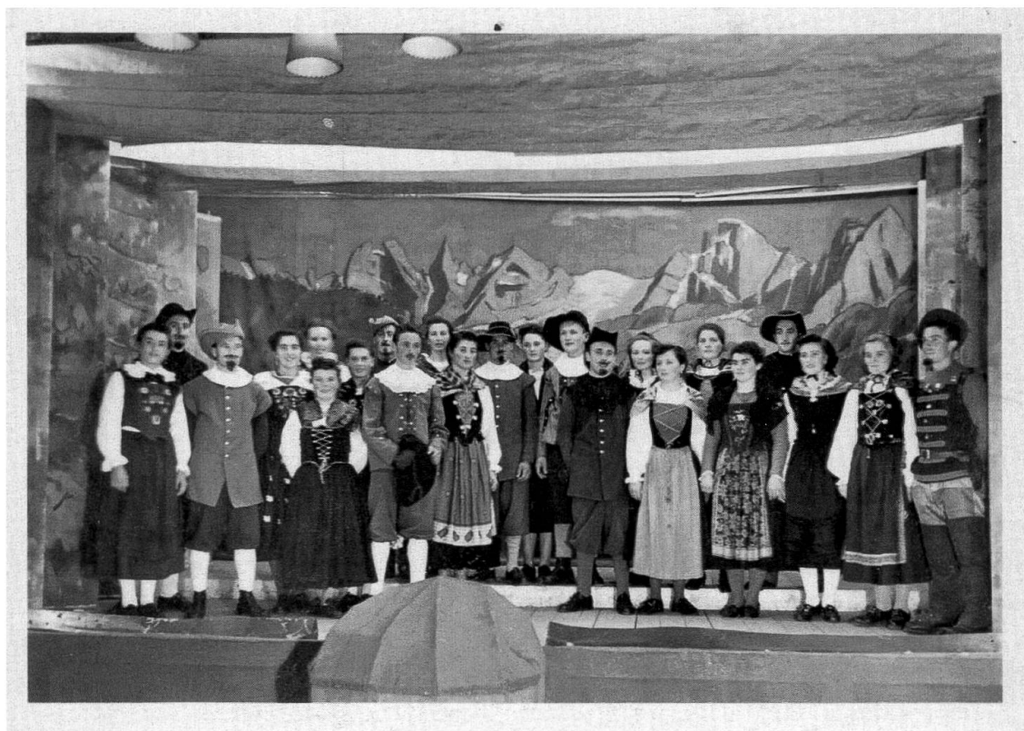
La gioventù e le donne di Soglio si incontrano al Plän Lüder, davanti alle montagne della Bondasca, e decidono di passare alla Riforma, foto dalla rappresentazione del 1952

Ora i suoi propositi sono di restare in valle, dove coltiverà i suoi fondi e si adopererà per il bene e la verità: è deciso a combattere la corruzione elettorale, denuncia