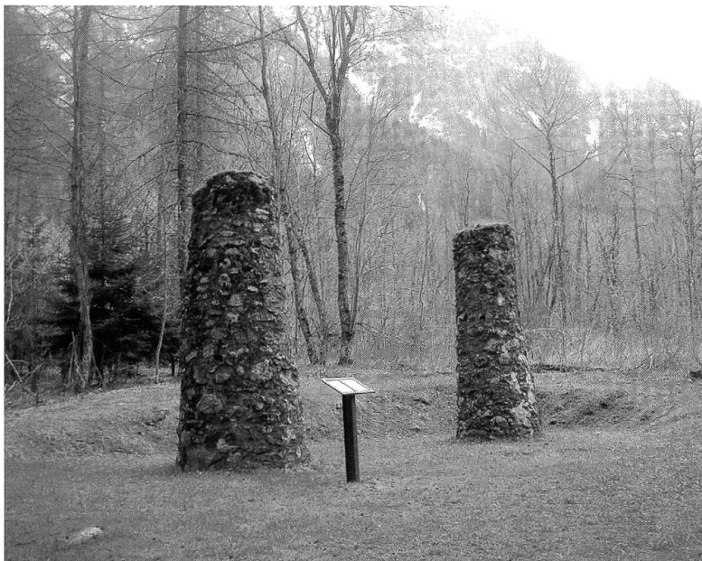
Le colonne della forca nel bosco di Cudin

larici e gli abeti. Nulla è stato distrutto. Sono testimoni silenziosi di un'epoca triste e buia, che per fortuna qui da noi è passata, ma che ci esortano a riflettere su quello che facciamo ancora oggi: pensiamo al mobbing sul posto di lavoro o a certe fotografie che presunti amici caricano in facebook: non sono forse una sottile variante della caccia alle streghe?