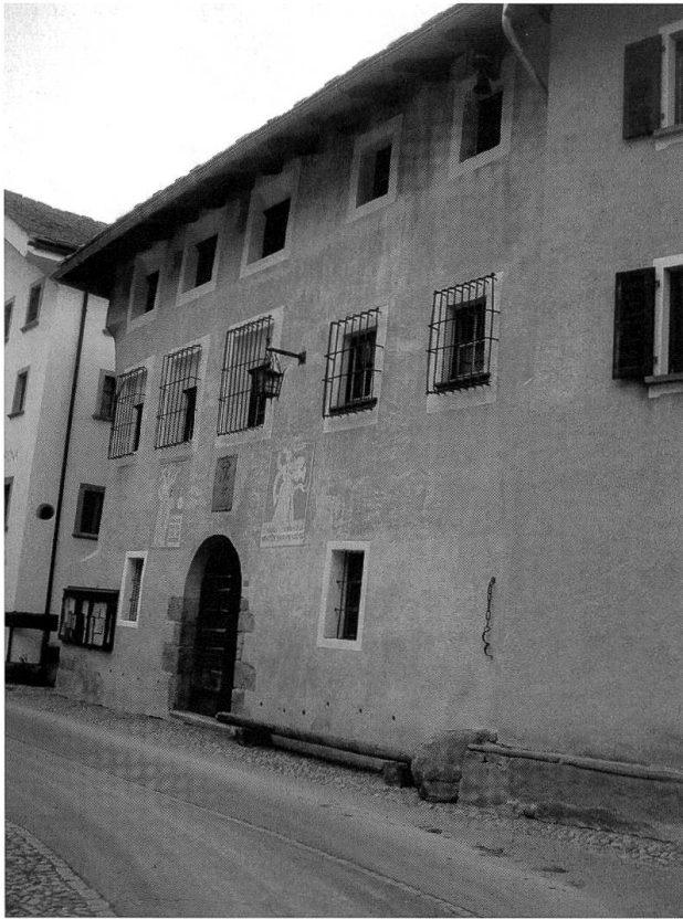
Il Pretorio a Vicosoprano

Con la sua opera, che per essere inscenata richiedeva la partecipazione di circa 80 attori di tutte le età, provenienti da tutti i villaggi della valle, egli è riuscito a spiegare