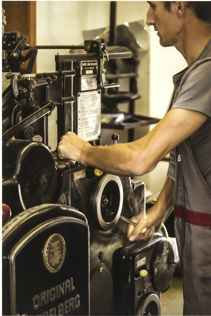
La Heidelberg che ha stampato per oltre 50 anni "Il Grigione Italiano"

M.M.: Al momento cerchiamo di ottimizzare i processi di lavorazione, il parco macchine è all'avanguardia e per il prossimo futuro non vi saranno grandi cambiamenti.